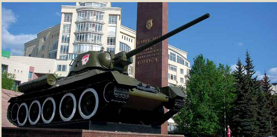
Памятник воинам Уральского добровольческого корпуса, 2012 г.

пична для данной модификации. «Экспериментальный образец или малообъяснимая подмена? Независимо от ответа этот танк — единственный в своём роде», — пишет историк Владимир Ивашкевич.