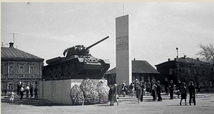
Памятник воинам Уральского добровольческого корпуса, 1963 г.

Открытие монумента ознаменовалось скандалом, в результате которого автор памятника и декоративного панно Павел Шардаков навсегда покинул Пермь.