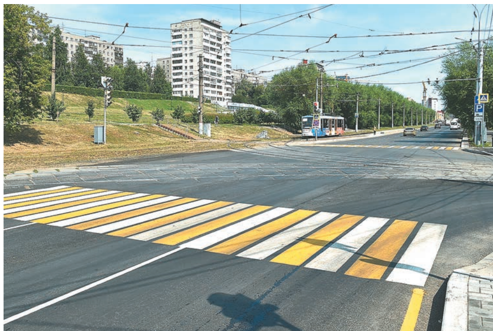
Ул. Петропавловская после ремонта по нацпроекту