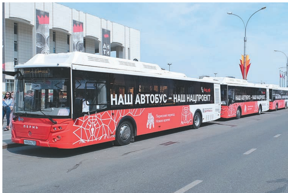
Новые автобусы для краевой столицы