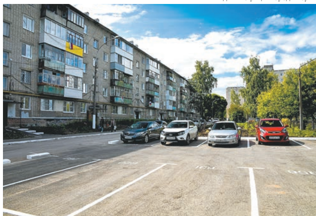
Благоустройство двора по адресу Серебрянский проезд, 7