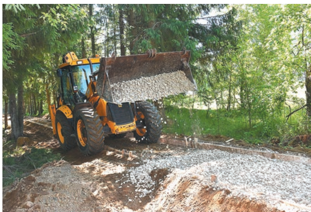
Вскоре теннисная аллея станет любимым местом прогулок

Отметим, что в 2020 году продолжается практика прошлого года, когда часть средств муниципалитеты смогут направить на обустройство контейнерных площадок. В этом году обустроят 1,1 тыс. площадок в 39 территориях края,