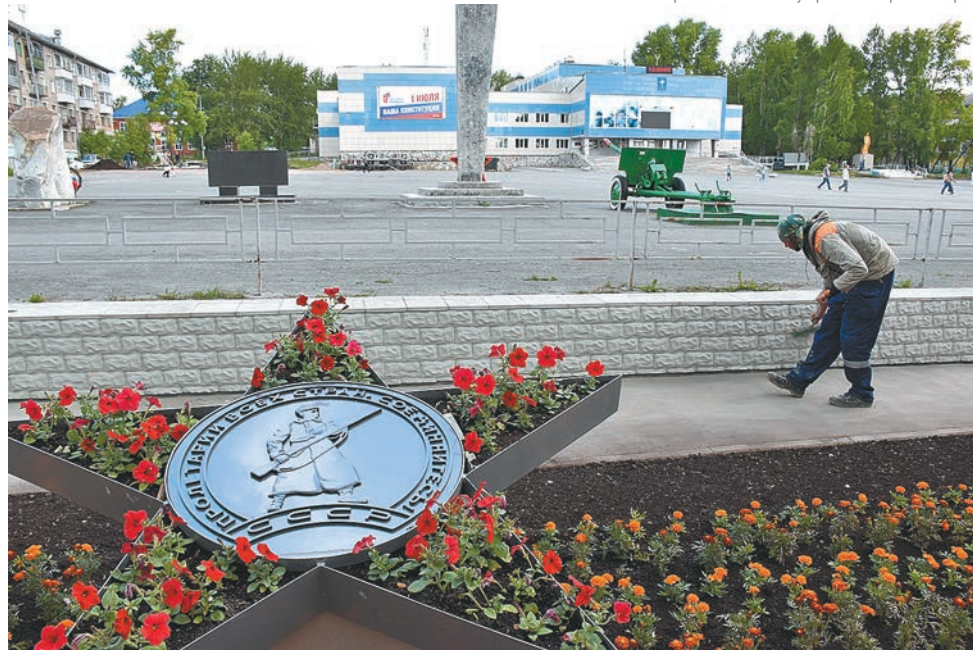
Площадь Победы в Звёздном украсил ландшафтный арт-объект «Красная Звезда»

Проекты «Соляная верста» из Соликамска и «Солнечная мечта» из Губахи стали победителями конкурса Минстроя РФ по благоустройству малых городов и исторических поселений. Федеральная конкурсная комиссия выбрала 80 проектов-победителей из 300 заявок, поступивших от 77 регионов. На реализацию проектов Соликамск получит 90 млн руб. из