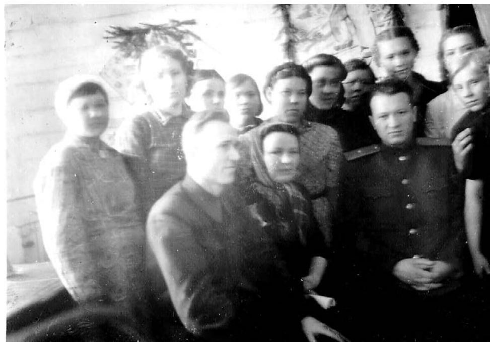
Юнгородок №1, общежитие №4, 1945 год

Как же счастливы сегодня уже очень пожилые люди, их дети, внуки и правнуки! Они считали, что в годы войны просто работали. Работали, как все, потому что так было надо. Но Родина оценила их работу как подвиг.