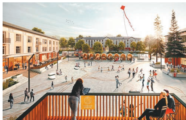
«Чусовские атланты» совместят историческое наследие и современные тенденции