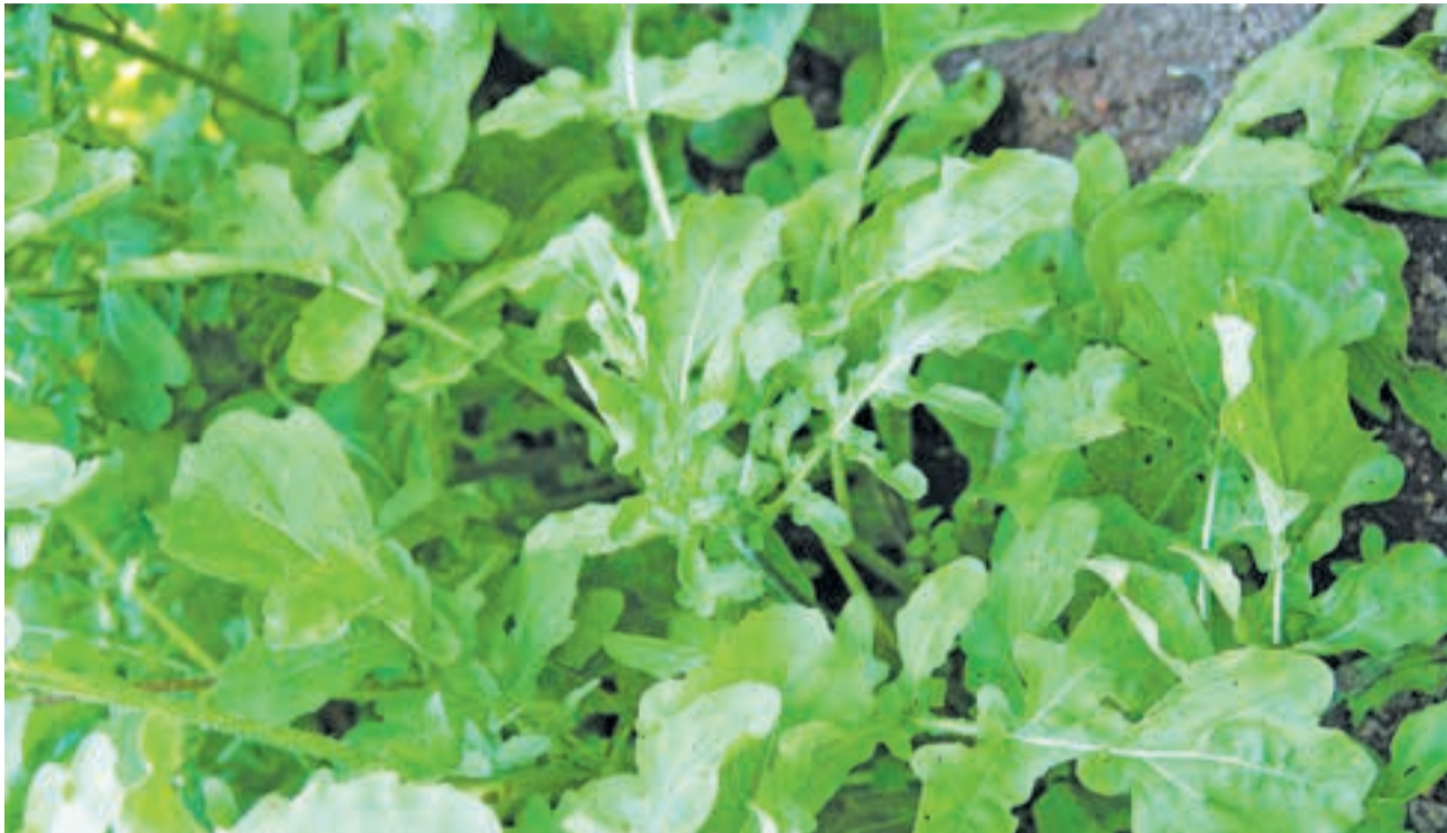
Рукола сорта Покер

В последние годы во многих странах мира особое внимание уделяют производству и потреблению овощей, объединяемых под общим названием «жёлто-зелёные» — по характерной окраске продуктивных органов. Самая известная среди них — группа листовых овощей. В пищу употребляют листья и молодые побеги таких растений.