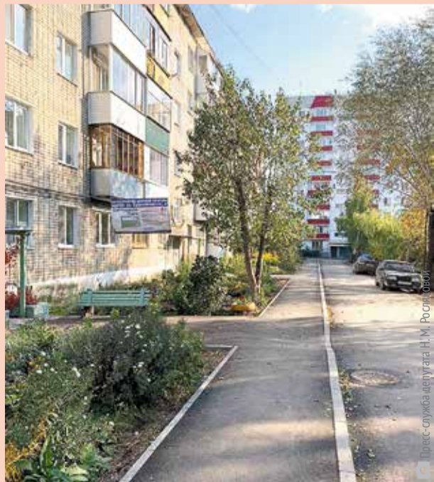
Пресс-служба депутата Н. Росляковой

Асфальтирование придомовых территорий провели по адресам: