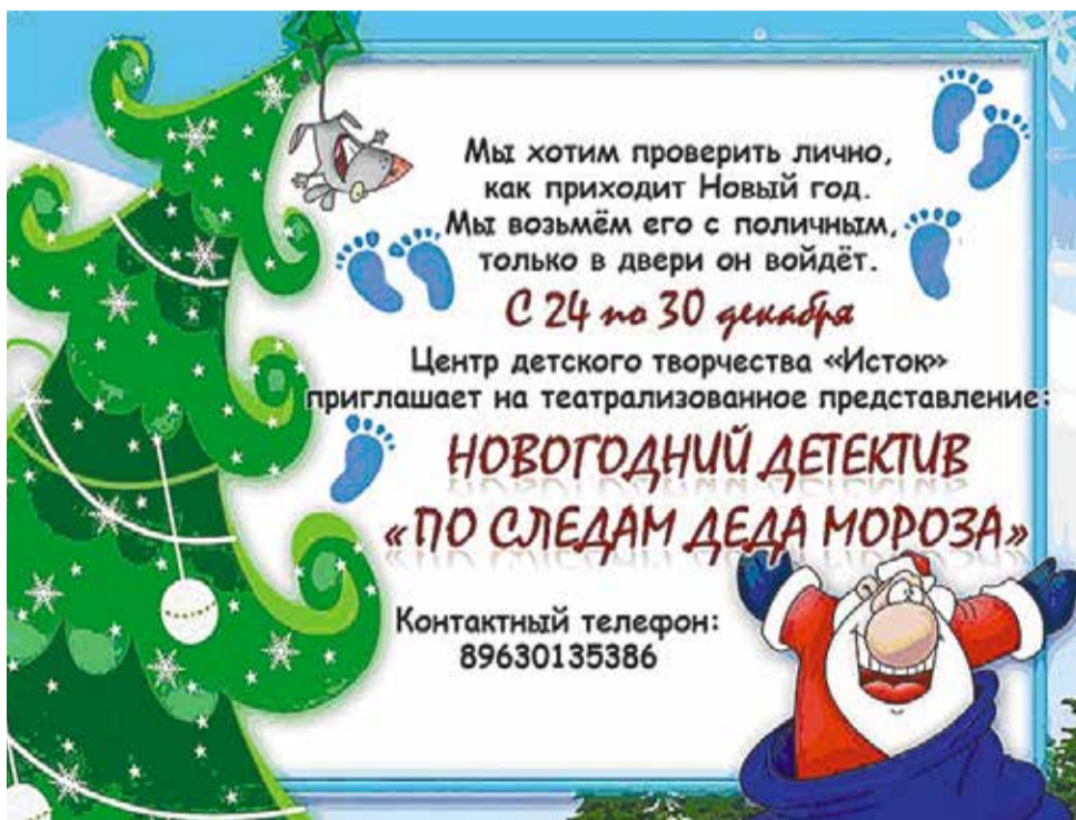
Пресс-служба депутата Н. М. Росляковой