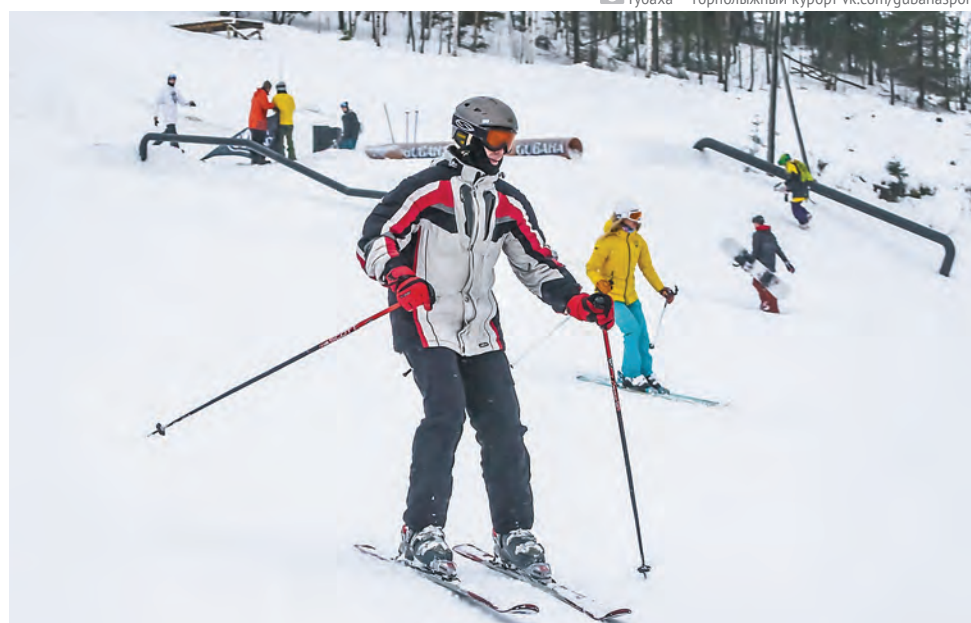
Губаха — горнолыжный курорт vk.com/gubahasport

Есть несколько предложений в Пермском районе. Горнолыжная база «Жебреи»