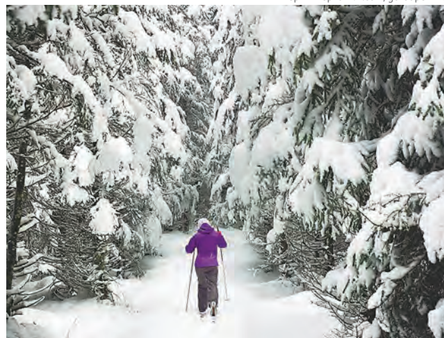
Пермь Первая vk.com/gorodpermu

находится вблизи одноимённой деревни, в 30 км от Перми. На её территории четыре трассы для катания. Услуги оздоровительного комплекса «Иван-гора» в посёлке Гамово (25 км от центра Перми) доступны круглогодично. Он располагает и современным горнолыжным центром. Работают два бугельных подъёмника. Горнолыжную базу «Гора» в деревне Глушата отличает размещение трасс для катания в хвойном лесу, что делает воздух исключительно чистым и полезным. Также работает бугельный подъёмник.