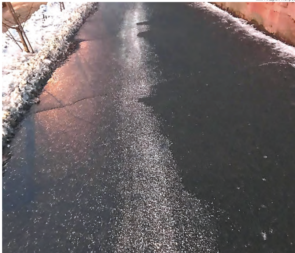
18 ноября, ул. Сибирская: тротуар, обработанный реагентом

В краевом минздраве озвучили статистику: в больницы и травмпункты региона 11 ноября поступило 636 пострадавших, служба скорой медицинской помощи зафиксировала 257 вызовов. Собственно, в Перми в день гололёда 11 ноября в больницы обратились 208 человек. Типичные диагнозы — переломы, черепно-мозговые травмы, сотрясения мозга, сильные ушибы. Одной женщине в результате падения пришлось ампутировать ногу.