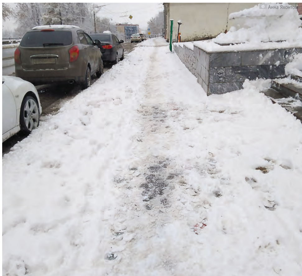
Пешеходные зоны некоторые подрядчики явно обделили вниманием

Это мировая классика, к которой в России только начинают привыкать.