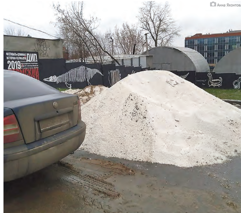
Реагенты должны не лежать на улице большими кучами, а находиться в контейнерах

Ещё одна манипуляция, которую используют против реагентов, — аллергия. Вра-