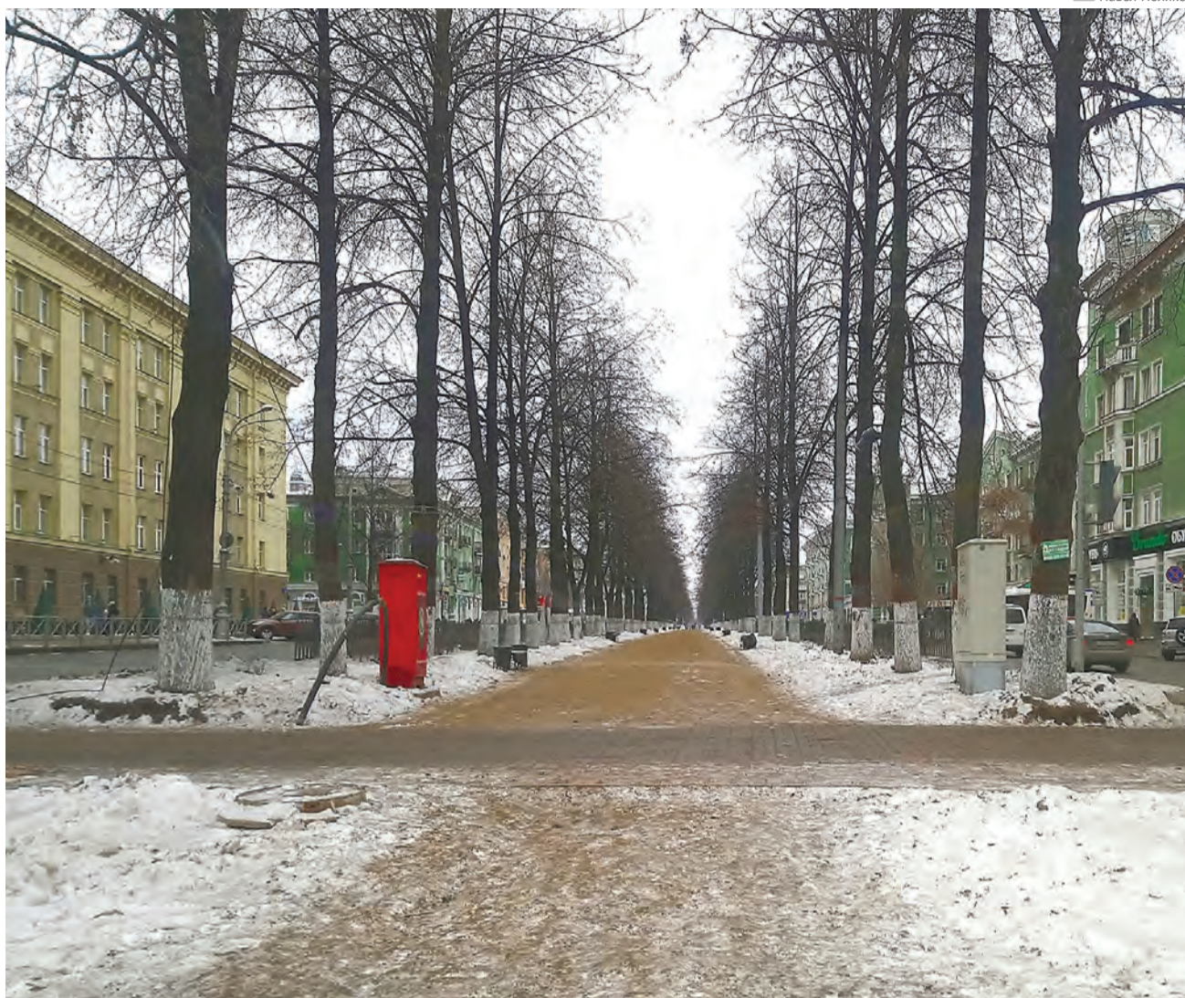
Средний город за зиму высыпает от 60 тыс. до 100 тыс. т песка, и убрать его полностью невозможно

В ночь с 10 на 11 ноября в администрацию Перми прогнозов о дожде со льдом не поступало. Тем не менее той ночью на улицы было