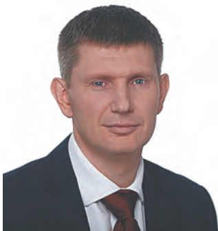
Губернатор Пермского края М. Г. Решетников