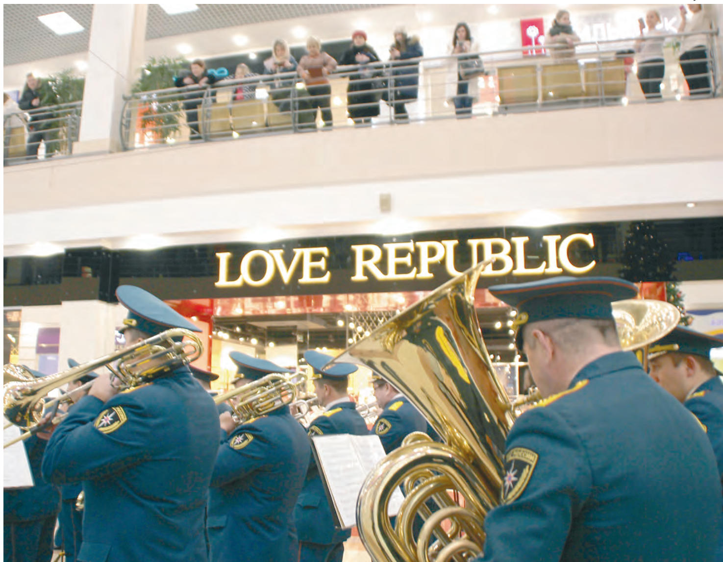
У МЧС за последний год увеличилось число внеплановых проверок

Бард и журналист — о диссидентском движении в разных странах, международном имидже России и своём творчестве