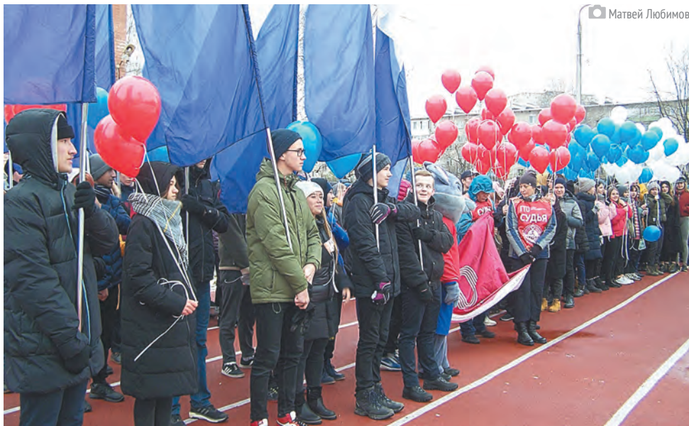
Ученики школы №41

тивный праздник прошёл на территории школы №41 в округе депутата Дмитрия Фёдорова в микрорайоне Краснова. Здесь возвели не менее впечатляющий спортивный объект. Спортивный школьный кластер вместил