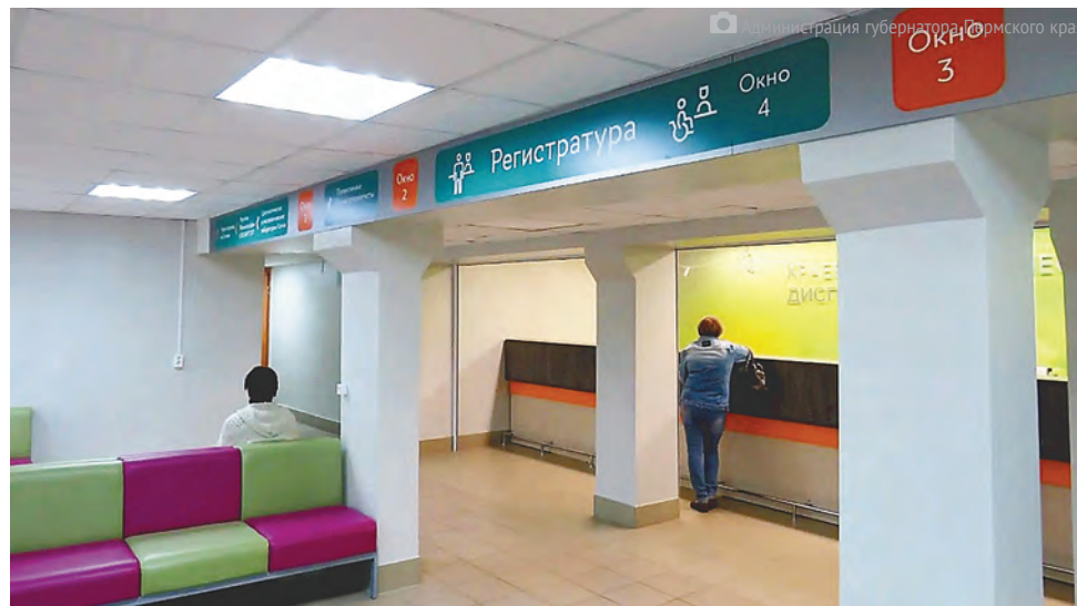
Поликлиника краевого онкодиспансера