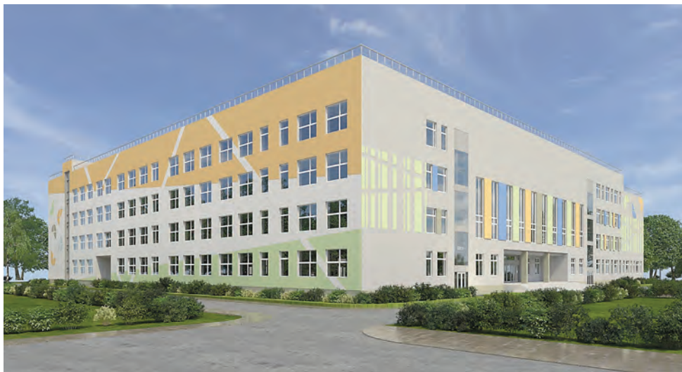
На карте города появятся новые корпуса образовательных учреждений

Публичные слушания по проекту бюджета Перми на 2020–2022 годы состоятся 7 ноября в Центральной городской библиотеке им. Пушкина (ул. Петропавловская, 25).