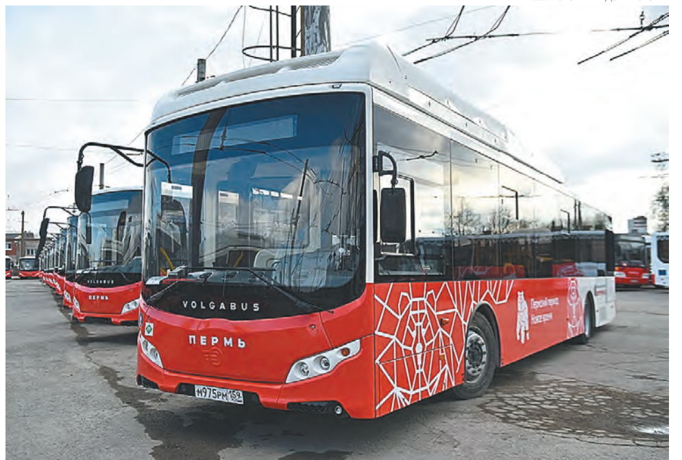
К концу 2024 года все автобусы в городе должны быть низкопольными, с кондиционерами и валидаторами

— Транспортная реформа — ключевая тема этого года. Она коснётся каждого жителя города, поэтому к её реализации следует подойти с умом. Реформа касается не только стоимости билета, но и качества услуг, безопасности, комфорта, и правиль-