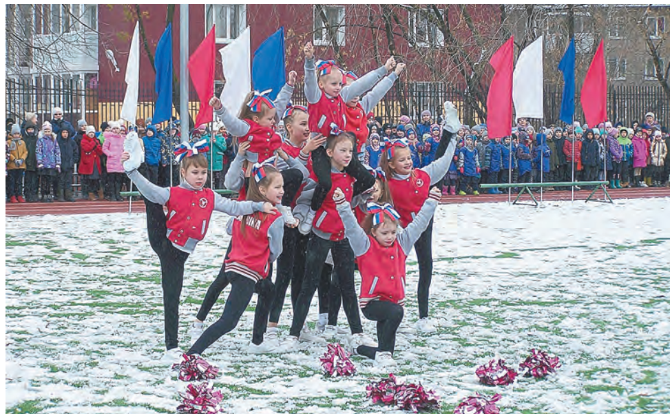
Показательные выступления воспитанниц центра чирлидинга New Star