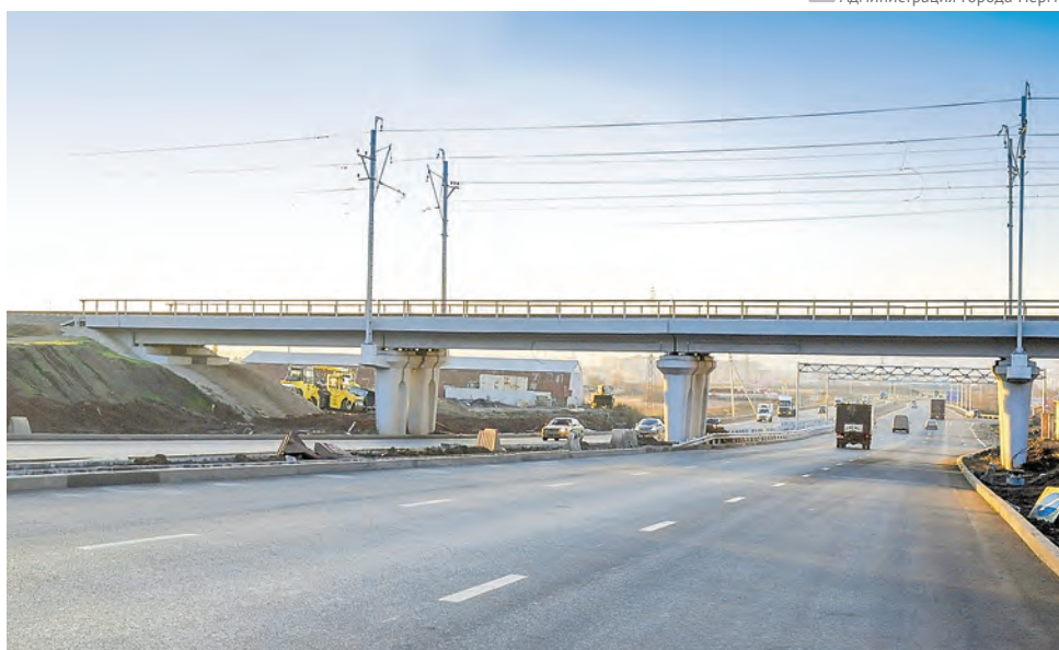
В краевом центре продолжится масштабное дорожное строительство

Дефицит городского бюджета в 2020 году составит 1,33 млрд руб., в 2021 году — 448 млн руб., в 2022 году — 636 млн руб. При этом основной его объём в 2020 году в сумме 936 млн руб. будет обеспечиваться переходящим с 2019 года остатком средств от поступления из бюджета Пермского края компенсации при отмене ЕНВД. В ходе исполнения бюджета планируется принятие мер, направленных на обеспечение сбалансированности бюджета города без привлечения заёмных средств.