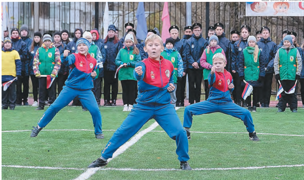
Своё мастерство гостям спортивного праздника в школе №82 демонстрируют юные мастера ушу

В настоящее время в Прикамье спортом и физической культурой регулярно (не менее трёх раз в неделю) занимается около 900 тыс. человек, что составляет более 36% населения края. К 2024 году в рамках нацпроекта «Демография», утверждённого президентом РФ Владимиром Путиным, этот показатель планируется увеличить до 55%.