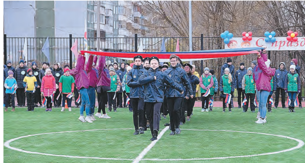
Торжественное открытие мини-стадиона у школы №82

виды спорта, которыми мы занимаемся, — это футбол, баскетбол и волейбол. Ещё недавно наша школьная спортивная площадка представляла собой песчаное поле с ямами и кочками, на ней невозможно было проводить спортивные игры,