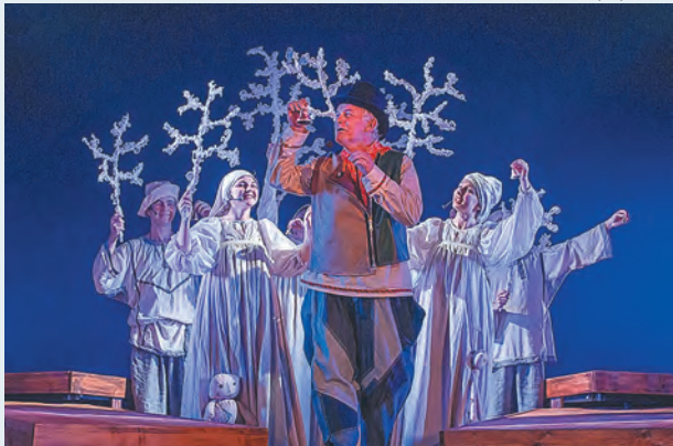
Сцена из спектакля «Не люблю — не слушай!»