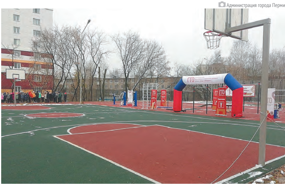
Баскетбольная площадка на мини-стадионе у школы №41

прошёл обильный снегопад, который покрыл белым покрывалом изумрудную арену футбольного поля. Однако это не помешало ребятам показать своё спортивное мастерство.