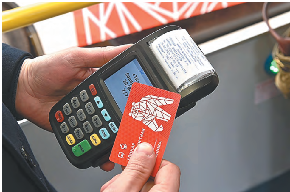
Тариф на проезд в транспорте может измениться в феврале следующего года