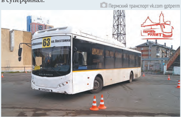
Пермский транспорт vk.com gptperm

Несколько десятков лучших представителей перевозчиков продемонстрируют свои навыки и умения в различных дисциплинах. Всего участникам конкурса предстоит выполнить восемь специальных заданий. Во время упражнения «круг» конкурсантам предстоит въехать через ворота на проезжую часть фигуры и, описав полный круг, выехать, не задев стойки. Упражнение «бокс» имитирует процесс парковки в гараж. Каждый из участников должен будет задним ходом въехать в условный бокс, вновь не задев стойки. Упражнение «тоннельные ворота» проверит у водителей чувство габаритов автобуса. Они должны будут проехать передним ходом двое ворот, не задев ограничители. Любимое многими упражнение «змейка» позволит оценить навыки скоростного маневрирования. Также участникам необходимо будет выполнить упражнения «колея», «эстафета», «стоп» и «автобусная остановка». По итогам соревновательного дня шесть команд выйдут в суперфинал.