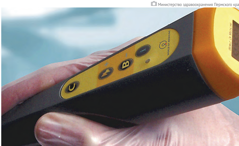
Нанотехнологичный аппарат Gamma Finder

«Этот прибор помогает определить стадию заболевания, радикальность предстоящей операции и методы последующего лечения. Раковые образования способны распространяться и поражать жизненно важные органы, такие как печень, лёгкие, мозг, молочные железы, костный мозг. Раковые клетки разносятся по всему