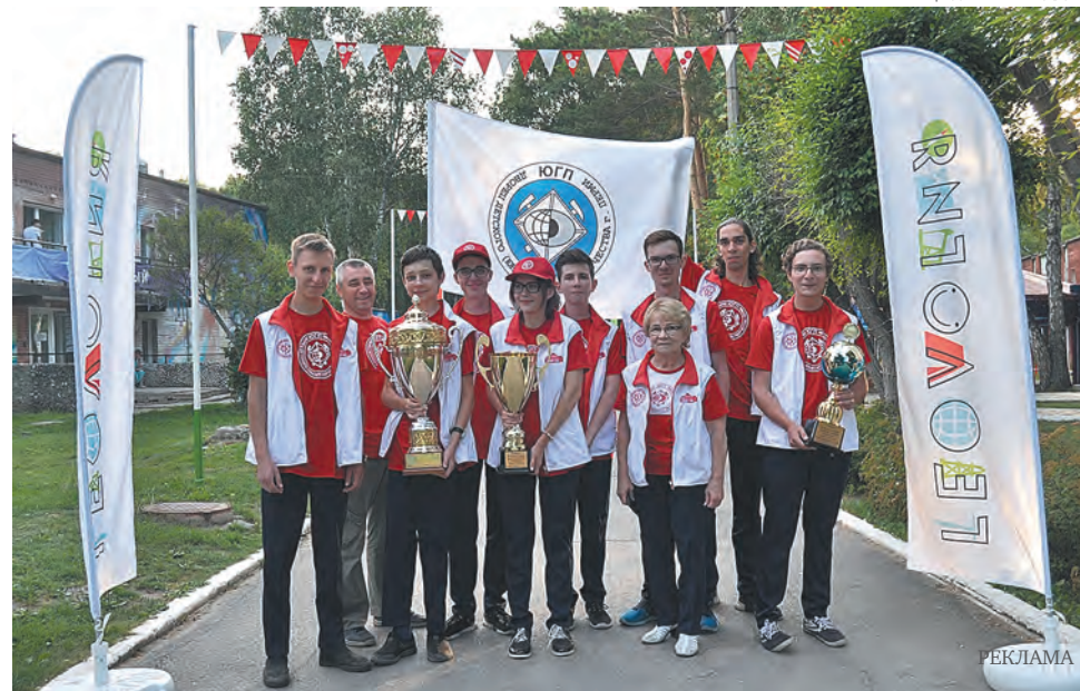
Команда «ЮГП» — абсолютный победитель Всероссийской открытой полевой олимпиады

Каждый из юных геологов по-настоящему влюблён в эту науку. Таков талант основателя и