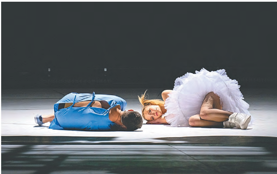
Спектакль «Пьяные» по пьесе Ивана Вырыпаева

Тем «особеннее» выглядят спектакли, где авторы от этого тренда отходят. Так, пермские «Пьяные» по пьесе Ивана