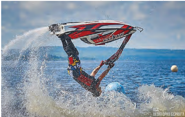
«Пермский период. Новое время», permfest.ru

Пермский край представил четыре проекта: фестиваль экстремальных видов спорта «Оса — акватория