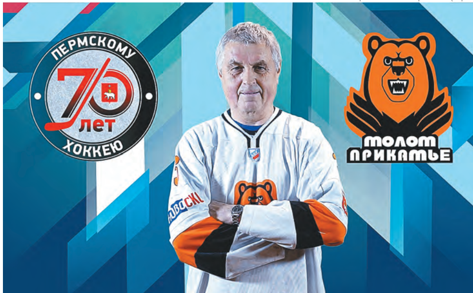
Сергей Смертин, наши дни

Рассказывают истории, связанные с Сергеем Смертиным, и знатоки хоккея. В своё время историк прикамского хоккея Никита Чернов так характеризовал нашего героя: «Сергей Смертин — хоккеист потрясающей работоспособности, лидер ко-