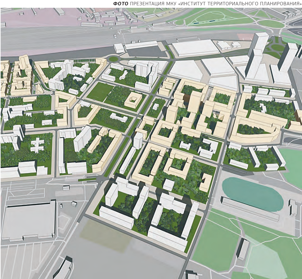
Концепция развития района ДКЖ

Сейчас прорабатываются варианты организации перекрёстков, где двухполосное движение (с каждой стороны) фактически превратится в трёхполосное, в том числе и в тоннеле под Транссибирской магистралью. То есть как минимум планируется расширение действующего