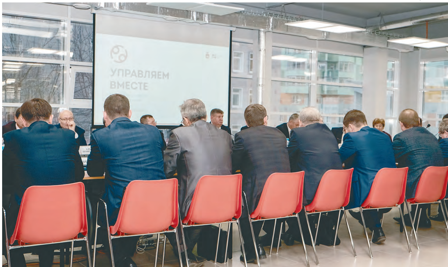
Работа на посту мэра небольшого города и главы муниципального района остаётся «мужской профессией»