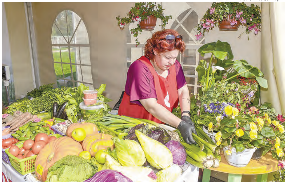
Администрация города Перми

На «Большой пермской дегустации» также работал