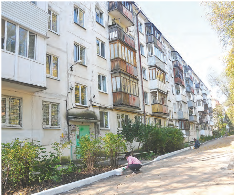
Ул. Макаренко, 44

За счёт средств федерального, краевого и муниципальных бюджетов финансируется основной перечень работ по благоустройству дворовых территорий. В рамках городских депутатских программ выполняется кронирование деревьев, обустройство детских и спортивных площадок, установка ограждений и многое другое. Все вопросы, связанные с благоустройством своих дворов, собственники реша-