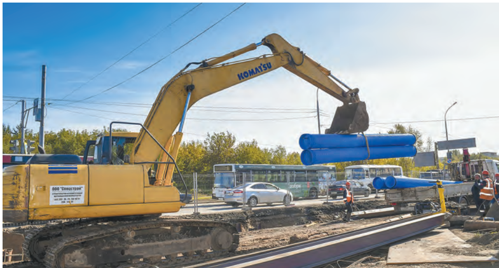
Ул. Героев Хасана

После окончания строительства качественно новой транспортной развязки у жителей и гостей Перми появится возможность осуществлять беспрепятственное и безопасное движение транспорта не только на этом участке, но и по всей протяжённости улицы.