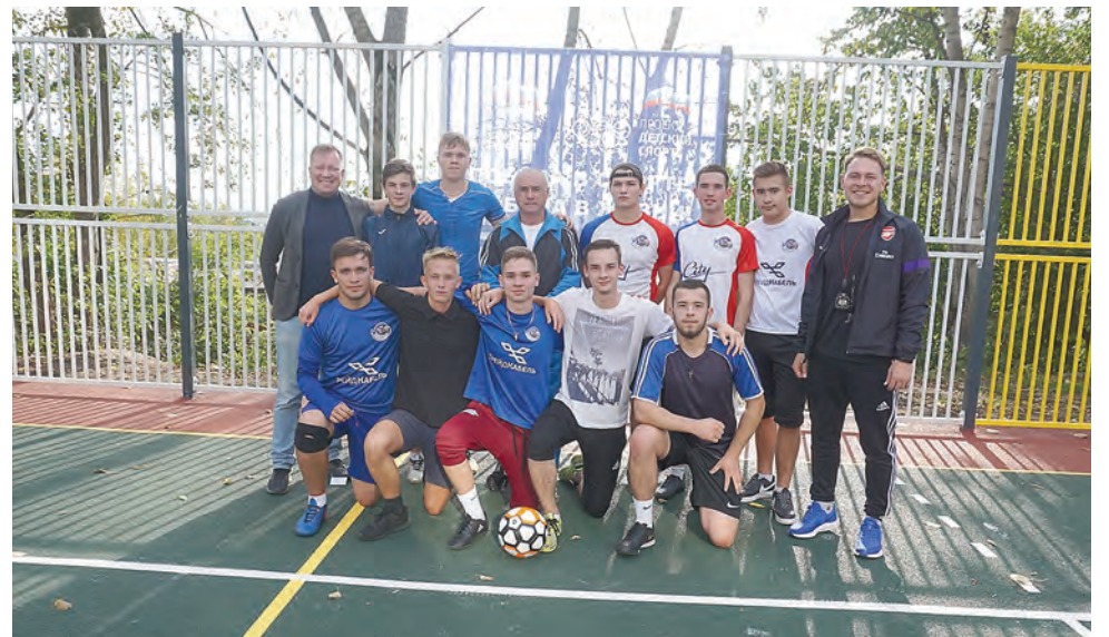
Спортплощадка на ул. Старцева, 5