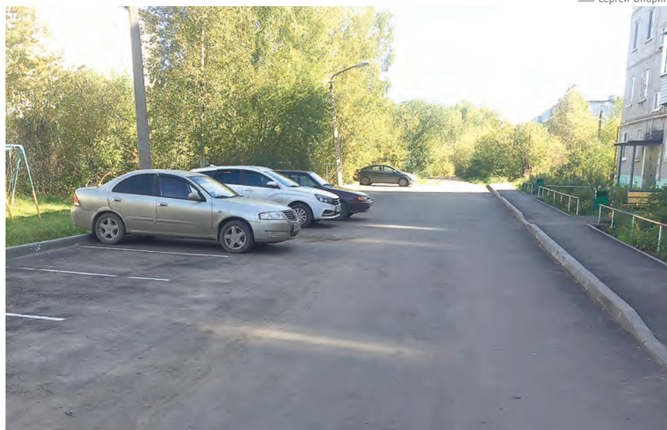
Новый междворовый проезд на ул. Бенгальской, 20