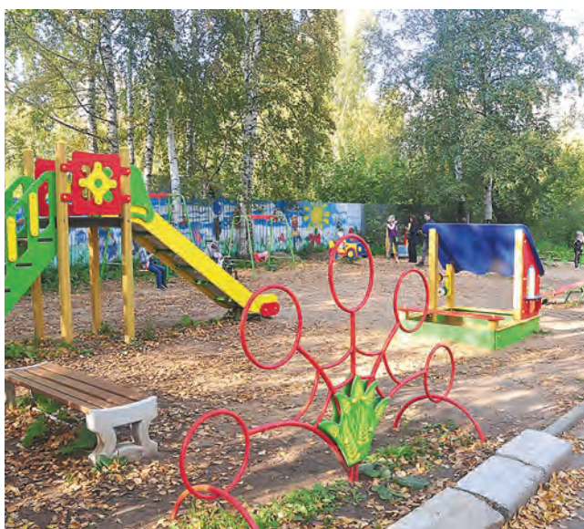
Новая детская площадка на ул. Таборской, 14

для пешеходов. Вдоль забора детского сада стихийно паркуются автомобили, которые выезжают на дорогу как хотят и когда хотят. Пешеходной же дорожки просто не было.