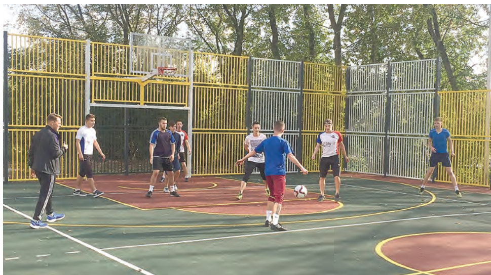
Спортплощадка на ул. Экскаваторной, 57

— Развитие спорта и приобщение к здоровому