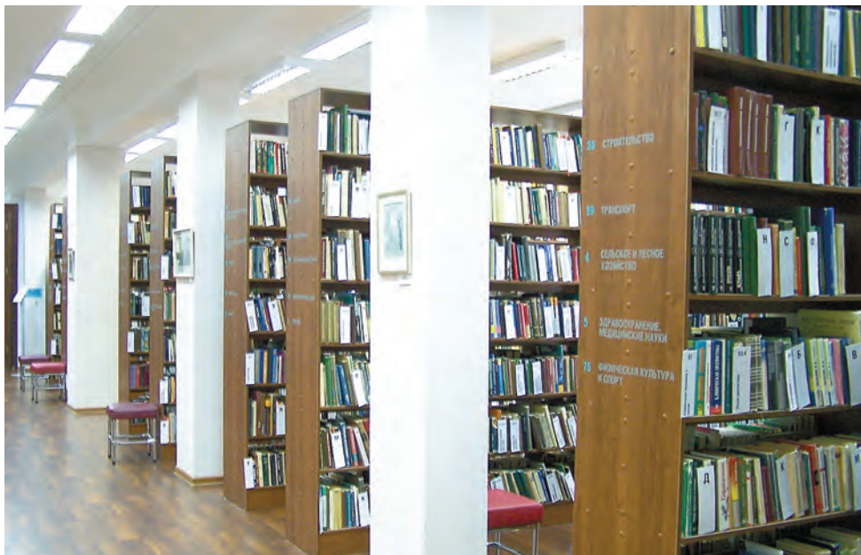
Книгохранение библиотеки им. Пушкина

При этом никто не собирается отказываться от печатных изданий. Многие пермяки до сих пор предпочитают именно этот вариант для чтения, ощущая теплоту бумаги и вдыхая неповторимый запах книг.