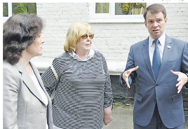
Пермская городская дума

Городскими властями этому учреждению оказывается постоянная поддержка в постановке спектаклей