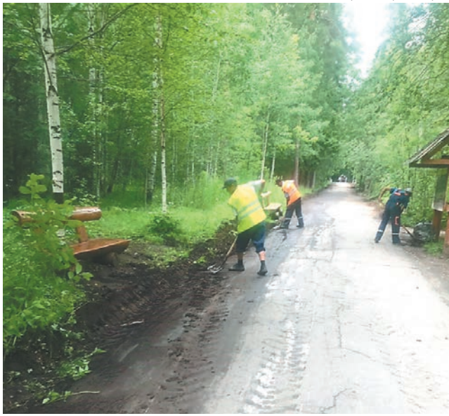
Администрация города Перми

В управлении внешнего благоустройства админи-