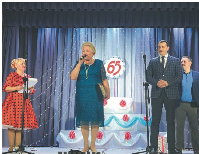
Гости поздравляют юбиляров