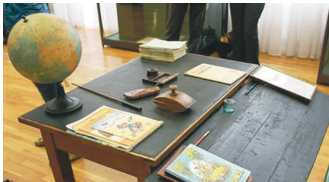
Парты позапрошлого века

В экспозиции представлен этап развития пермской промышленности от 1918 до 1968 года, который позволяет показать как дореволюционный уровень развития города и его производств, так и расцвет пермской промышленности, пришедший на 60-е годы прошлого века. В экспозиции выставлены фотографии города, пермских заводов, пристаней, железнодорожных станций, а также жителей Перми — рабочих, мастеров, инже-