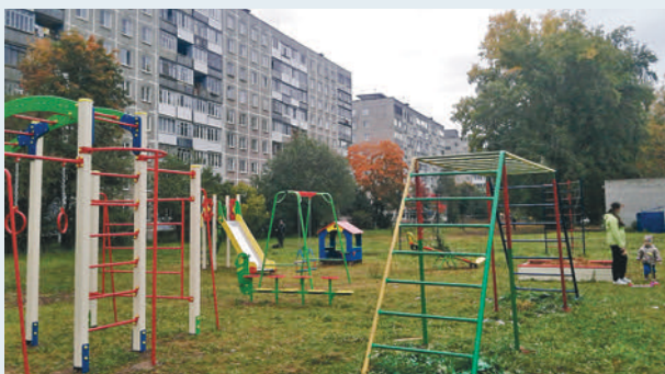
Новая игровая площадка

Так, жильцы дома по ул. Советской Армии, 37 сами обустроили зону отдыха во дворе со скамеечками, беседками, выращивают розы, георгины, гортензии, установили во дворе детскую площадку, спортивную площадку с тренажерами. За счет федерального финансирования в этом году во дворе их дома выполнено асфальтирование придомовой территории, внутридворового проезда, тротуара, обустроена парковка, покрашены бордюры.