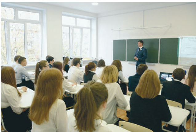
Идет «Думский урок»

неров. В частности, на них запечатлены «Пермские моторы», завод имени Калинина, «Пермнефтеоргсинтез» и другие ведущие предприятия Прикамья. Есть в экспозиции и продукция заводов и их история.