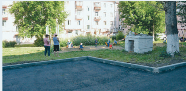
Двор после ремонта

Во дворах были заасфальтированы проезды и тротуары, установлены и покрашены бордюры, оборудованы парковочные места для машин, появились новые скамейки и урны. Жильцы домов сами решали, какие именно работы будут проводиться в их дворах, и принимали в работах активное участие. Пермьки высаживали деревья, кустарники, цветы, убрали территорию двора, украшали ее.