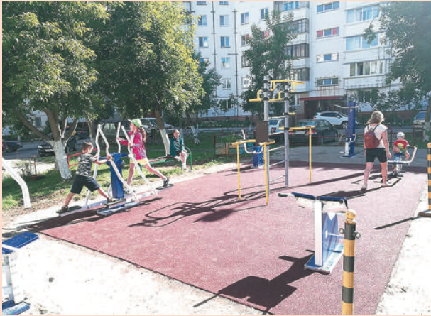
Ул. Уинская, 8