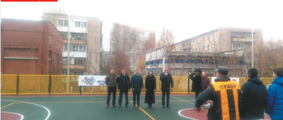
Открытие стадиона на ул. Подольской