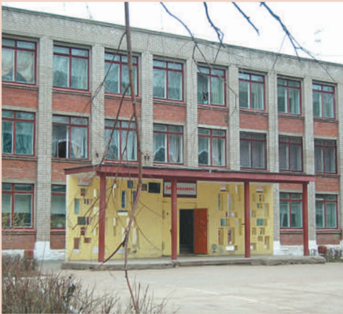
МАОУ «СОШ №133»

Также по просьбам жителей произошло переименование остановочного пункта «Дом быта «Садовый». Теперь остановка называется «Сквер журналистов».