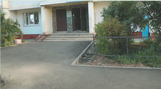
Ул. Уинская, 4а