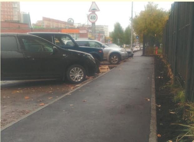
Тротуар на ул. Пушкарской (чётная сторона)