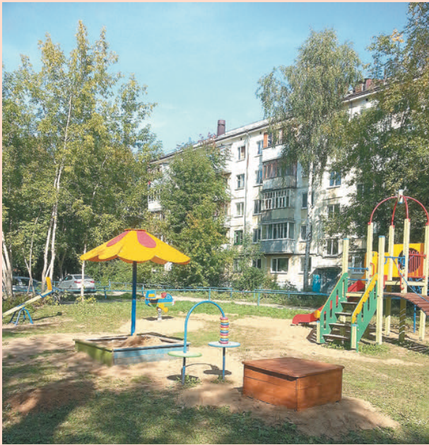
Ул. Крупской, 86а