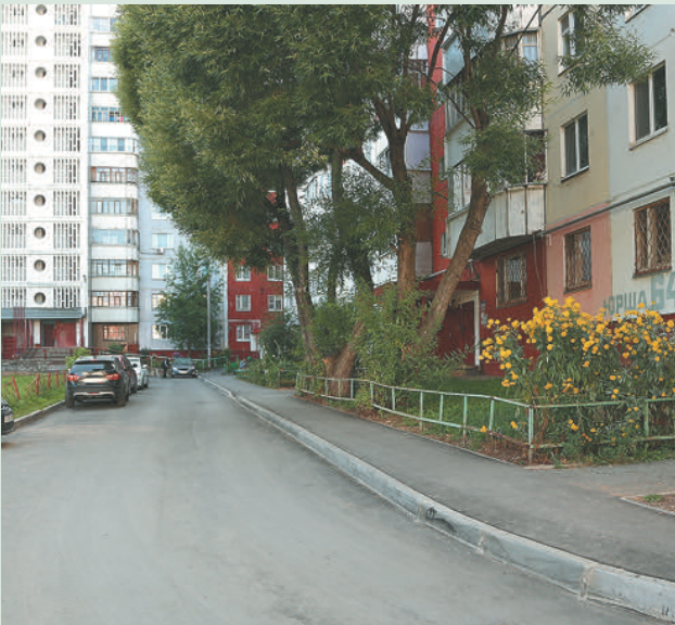
Ул. Юрша, 64