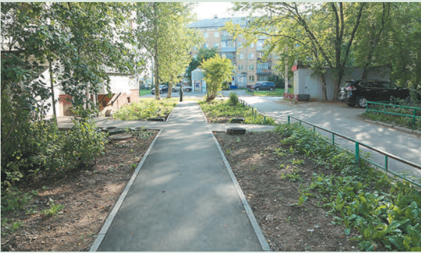
Ул. Старцева, 37