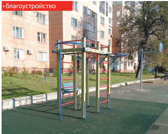
Двор по ул. Кировоградской, 4