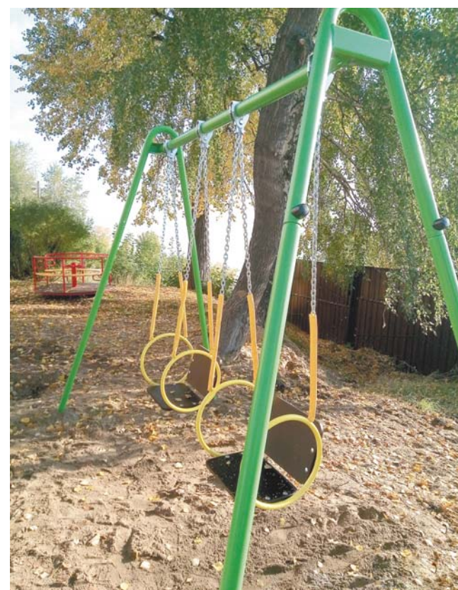
Двор по ул. Кировоградской, 4

— В рамках 300-летия Перми запланированы и уже реализуются масса проектов, направленных на преобразование облика города.