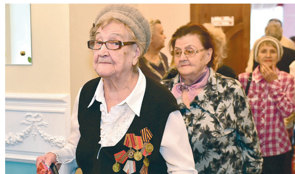
Мероприятия к Дню Победы!