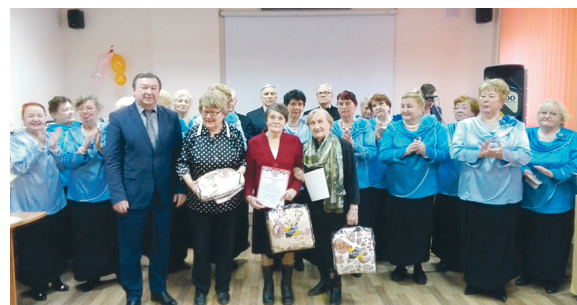
Ленинской районной организации инвалидов — тридцать лет