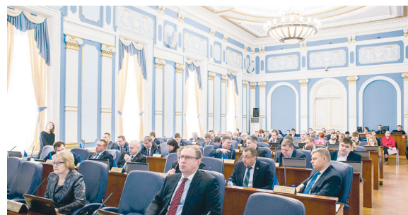
На пленарном заседании Пермской городской Думы