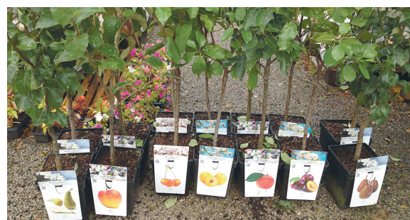
Десять советов при выборе саженцев