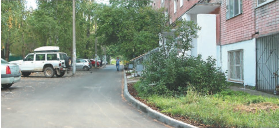
Обновлённый двор на ул. Старикова, 49