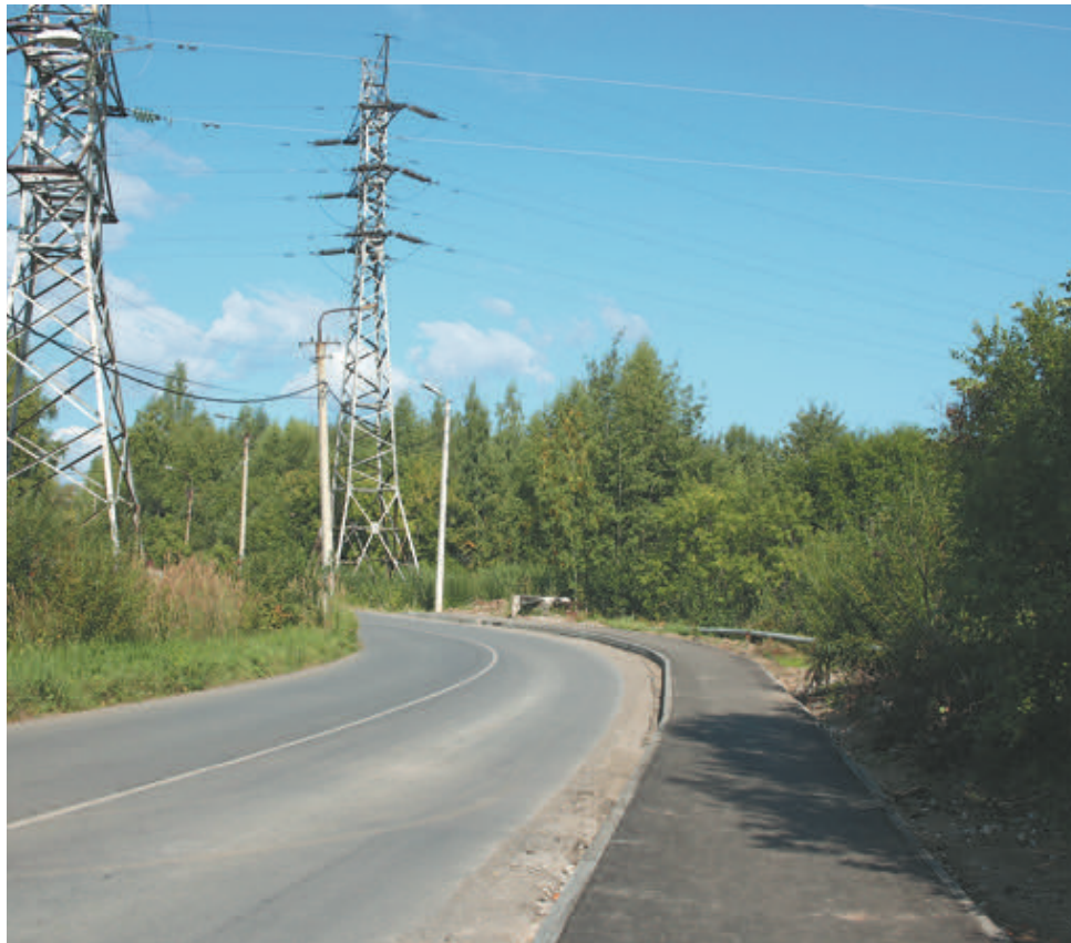
Тротуар на ул. Бумажников

Хорошей новостью для жителей Орджоникидзевского района стал ремонт клуба им. Пушкина. Учреждение культуры было в плачевном состоянии — даже крыша