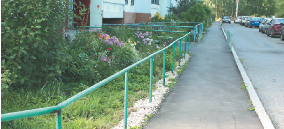
Двор дома на ул. Менжинского, 45