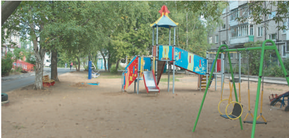
Детская площадка на ул. Александра Щербакова, 45 и 47

КСТАТИ. Буквально в эти дни в микрорайоне Голованово устанавливают бетонные опоры под освещение. Это плоды текущей депутатской работы: администрация района идёт навстречу жителям и выполняет наказы депутата.