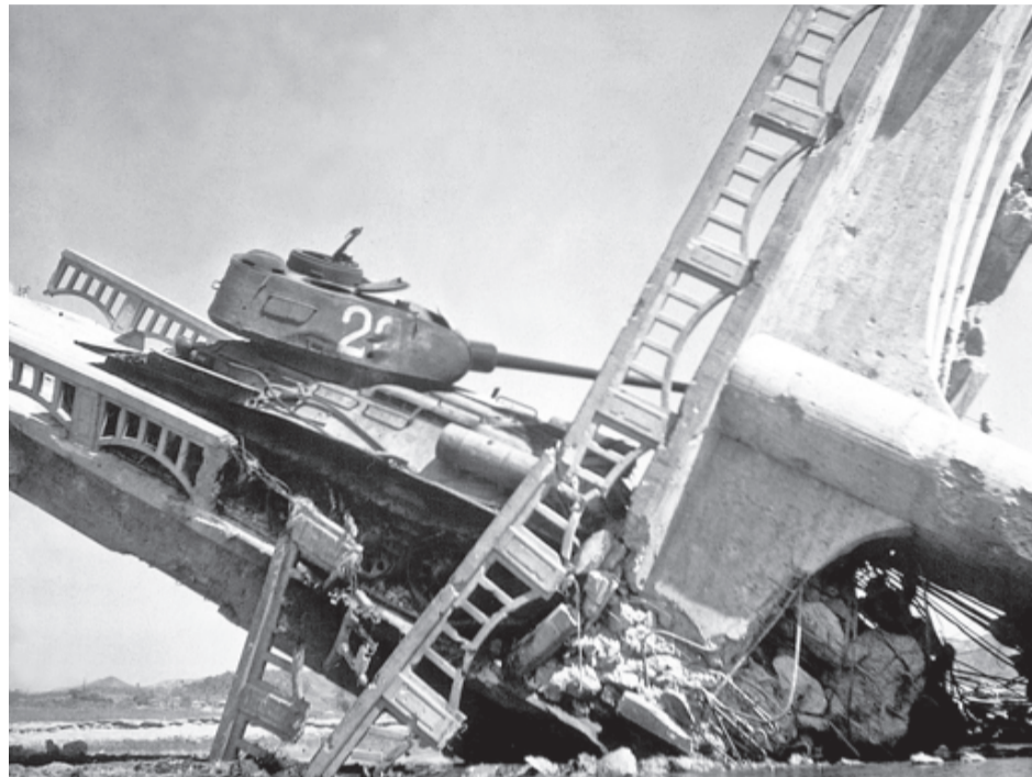
«Корейский» танк Т-34 на разрушенном американцами мосту