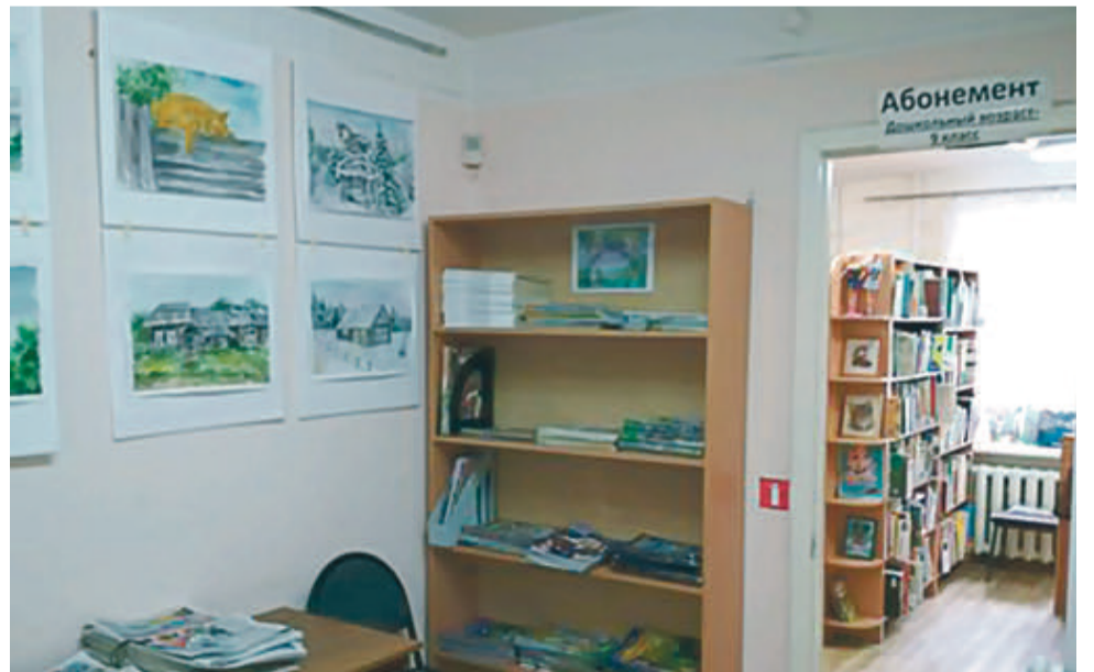
Библиотека явно требовала обновления формы и содержания