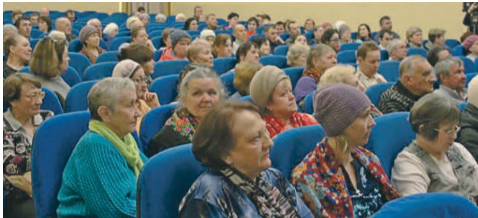
На обсуждение новой системы работы городского транспорта пришло много жителей района

Проблемные вопросы района планируется решить за счёт совершенствования маршрутной сети. В результате должны появиться новые транспортные связи.