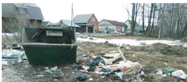
Контейнерные площадки в Январском выглядят очень неопрятно, но, во всяком случае, они теперь есть

В феврале-марте этого года жители частных домов стали получать квитанции на оплату услуг по вывозу ТКО. Не стали исключением и жители микрорайона Январский Орджоникидзевского района Перми. Сумма вроде небольшая — 71 руб. «с копейками» с домовладельца. Но недоумение жителей вызвал тот факт, что на тот момент они ни сном ни духом не знали о том, что им оказывается такая «услуга». Специальных контейнеров никто не видел в глаза, об их расположении не было никакой информации. Не со-