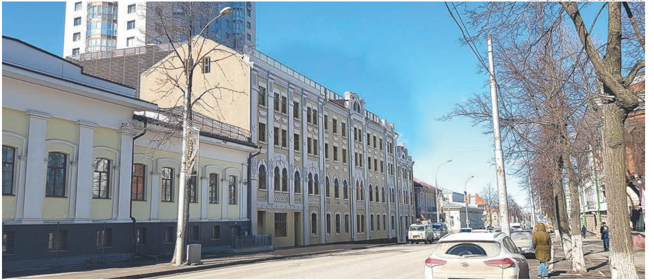
Проект реконструкции здания бывшего пивзавода на ул. Сибирской, 35

Вот что писала городская управа 27 августа 1911 года: «В усадьбе Ижевского товарищества по Сибирской улице №33 производится постройка каменного дома, причём занятый местами