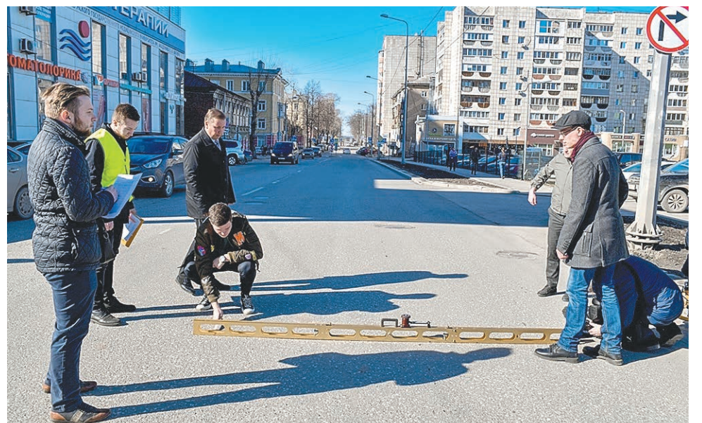
Проверка участка дороги на ул. 25 Октября