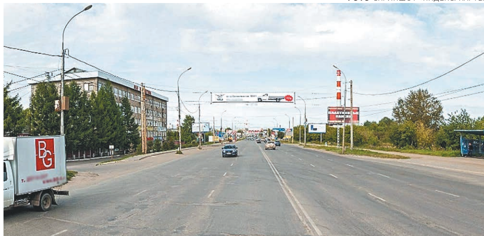
ФОТО СКРИНШОТ «ЯНДЕКС. КАРТЫ»