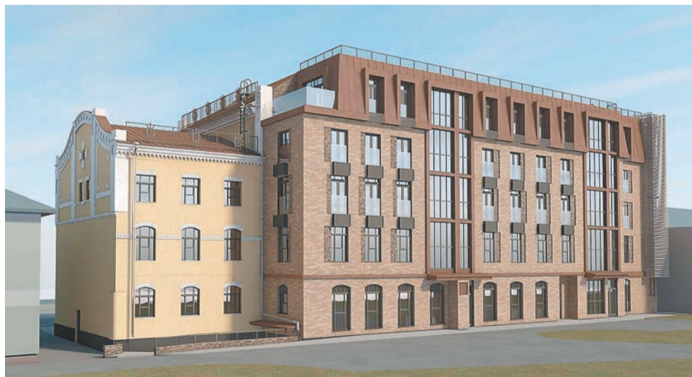
Внутренняя, «скрытая» часть здания будет осовременена