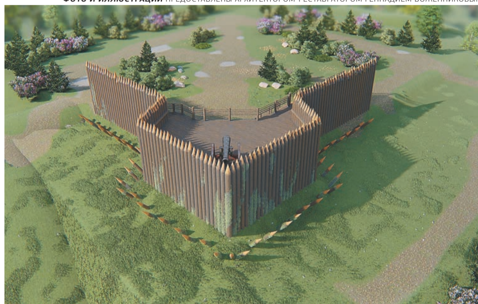
ФОТО И ИЛЛЮСТРАЦИИ ПРЕДОСТАВЛЕНЫ АРХИТЕКТОРОМ-РЕСТАВРАТОРОМ ГЕННАДИЕМ ВОЖЕННИКОВЫМ

По итогам заседания комиссии по землепользованию и застройке публичные слушания признаны состоявшимися. Окончательно вопрос зонирования должны решить депутаты гордумы на пленарном заседании.