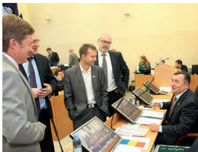
Пленарное заседание в зале Учёного совета Пермского политеха. 2013 год