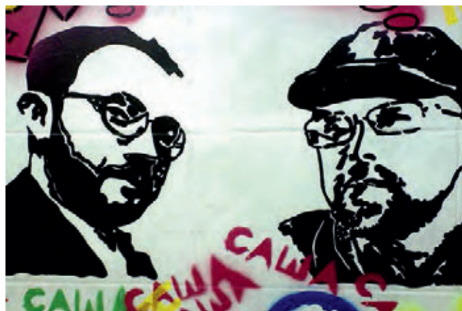
«Гельман vs Иванов», рисунок Александра Жунёва. 2009 год