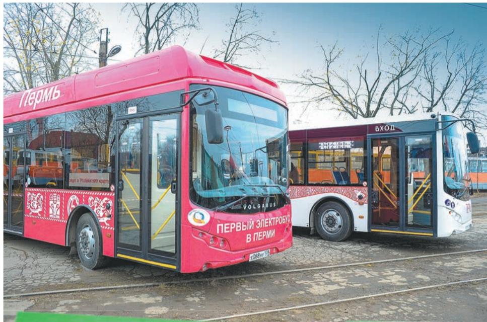
Администрация города Перми

В Орджоникидзевском районе обозначили ряд транспортных проблем, связанных с переполненными в часы пик автобусами, при этом ожидание их достаточно длительное, а сами поездки занимают много времени. Отдельные микрорайоны не имеют связи с центральной частью города, отсутствуют маршруты с за-