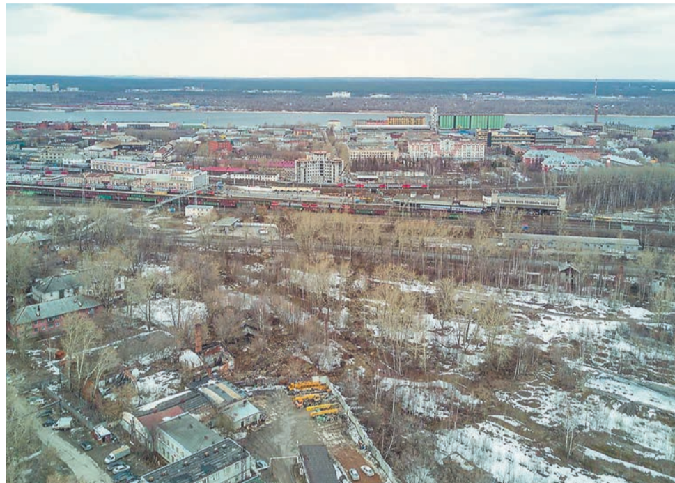
ФОТО ПРЕЗЕНТАЦИЯ ПРОЕКТА «ПЕРМЬ — 300 ЛЕТ НА КАМЕ» Стоимость работ по сносу 18 зданий товарного двора оценили в 5,9 млн руб.

Так как в 2019 году правительство РФ возобновило финансирование региональных программ по ликвидации аварийного жилья, большую часть жилья, признанного аварийным после 1 января 2012 года, в Прикамье расселят за счёт федерального бюджета. В связи с этим краевые власти решили перераспределить часть сэкономленных средств краевого бюджета, предусмотренных на реализацию региональной адресной программы, на ремонт домов с признаками ветхости и расселение отдалённых посёлков.