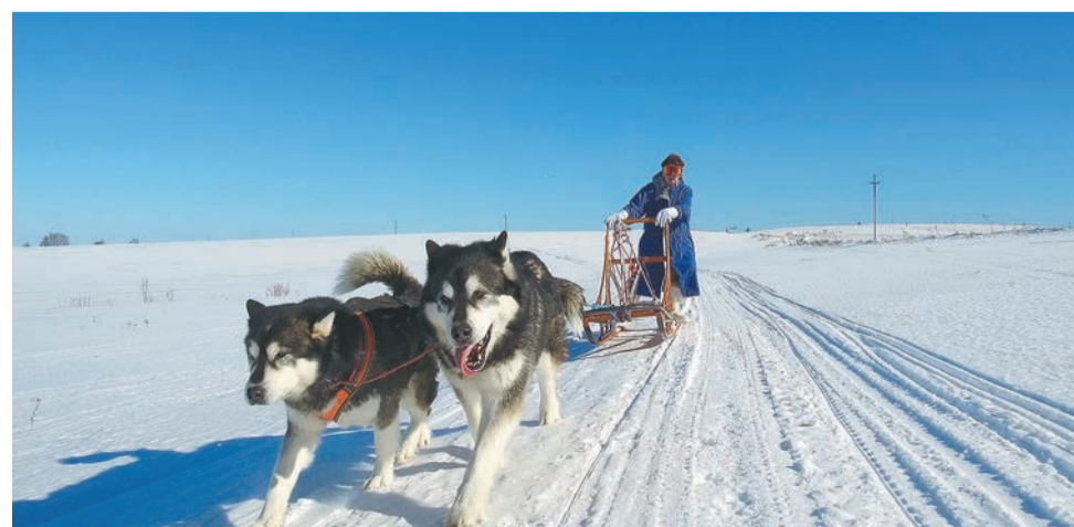
Кадр из фильма «Под куполом неба»

Безусловно, «По направлению к будущему» получит свою благодарную аудиторию, ведь его будут смотреть выпускники университета, которые увидят на экране знакомые места, любимые людей. Приятное узнавание — залог успеха, однако за пределы этого круга успех фильма вряд ли распространится.