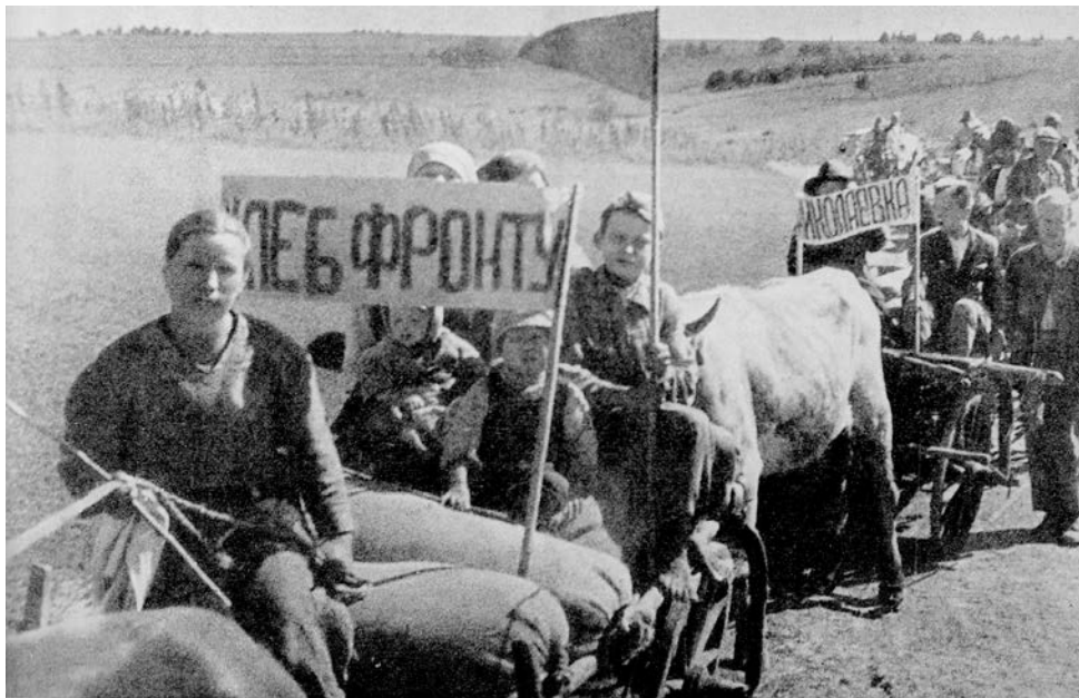
Конный обоз с лозунгом «Хлеб фронту» (Молотовская область, 1940-е годы)

ческий завод, вывезенный с берегов Невы в июле–августе 1941 года. Вместе с ним прибыли 228 рабочих и специалистов, а также члены их семей. До эвакуации этот завод производил радиотрансляционную арматуру, зарядные станции, сварочные агрегаты, но в Молотове на него возложили задание по освоению массового выпуска военно-полевых телефонных аппаратов УНАФ. В период с 1941 по 1945 год предприятие выпустило 234 тыс. полевых телефонных аппаратов.