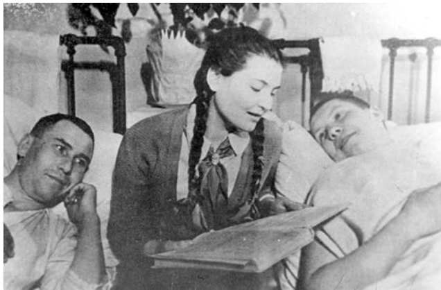
Пионерка в госпитале читает книгу раненым (1940-е годы)

Молотовская область к концу 1942 года приняла 78 интернатов и 50 детских садов из Ленинграда и около 10 тыс. детей школьного и дошкольного возраста. Это составляло 53% всех эвакуированных детских учреждений и 48% детей из других регионов страны. Только 12 июня 1945 года вышло решение исполнительного комитета Молотовского областного Совета депутатов трудящихся