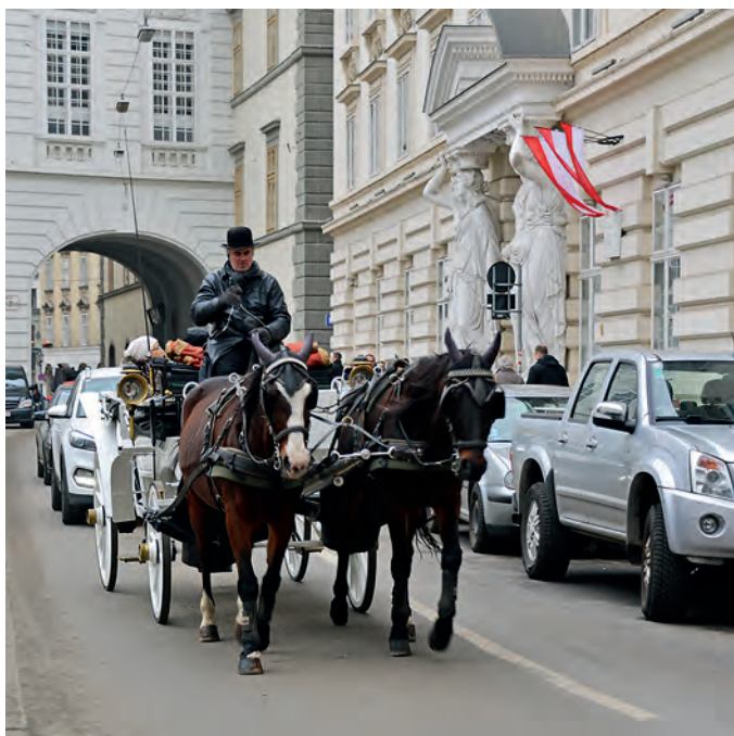
Популярный вид транспорта