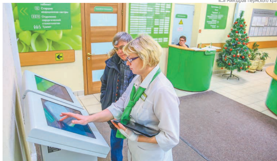
Минздрав Пермского края

Ещё одна проблема в работе поликлиник стояла очень остро — приём «незасписанных» пациентов. Кто хоть раз бывал в медучреждении, наверняка сталкивался с теми, кто пришёл на приём без записи. По разным причинам. Это сбивало