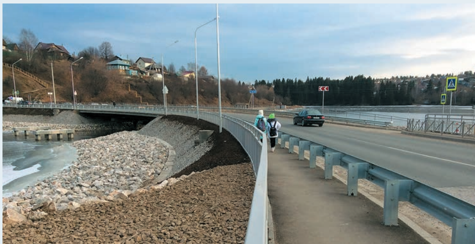
Новый мост через реку Вож в Добрянке жители ждали полвека

Новый мост такой же, как и прежний, двухполосный, но шире старого, с выделенными пешеходными тротуарами по обеим сторонам, барьерным и перильным ограждением. В ходе капитального ремонта подрядчик не только провёл работы по выносу