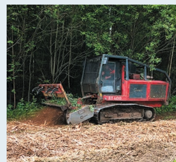
Так выглядит мульчер

Мульчирование. Его проводит специальный трактор на гусеничном ходу (мульчер). Он измельчает всю растительность на обочине дороги (кустарники, сорняки и даже пни), преобразует её в щепу. Вся щепка идёт на присыпание полосы отвода, что позволяет в течение не менее трёх-четырёх лет не беспокоиться о нормативном состоянии полосы отвода. Щепка надёжно защищает от поросли. За рабочую 10-часовую смену мульчер может расчистить до 10 км полосы отвода. Бригада рабочих из шести человек с таким объёмом работ не справится и за три недели. Мульчер применяли при проведении работ на дороге Пермь — Ильинский.