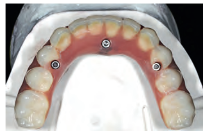
Постоянный несъёмный протез по технологии Trefoil («Все на трёх»)