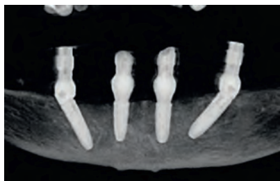
Рентгенологический снимок сразу после установки имплантов

Пермь, ул. Пермская, 161 тел.: +7 (342) 258-34-34, 258-39-39 астрamedцентр.рф