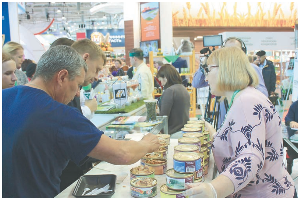
Дегустация тушёнки АО «Пермский свиноплекс»

Более того, власти оказывают сельхозпроизводителям поддержку, вкладывая средства не только в конкретные проекты, но и в развитие села в целом. И это должно способствовать в том числе решению кадровой проблемы. «Конечно, мы будем финансировать программы, связанные с дорогами, газификацией, строительством школ, детских садов в сельской местности, проведением на село интернета. Большая программа предусмотрена по ФАПам, строительству амбулаторных комплексов», — заверил Максим Решетников.