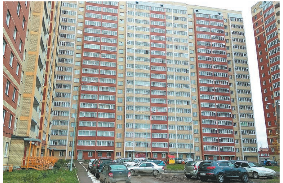
Дом на ул. Самаркандской, 143 — один из шести домов, достроенных «Камской долиной» уже в ходе процедуры наблюдения