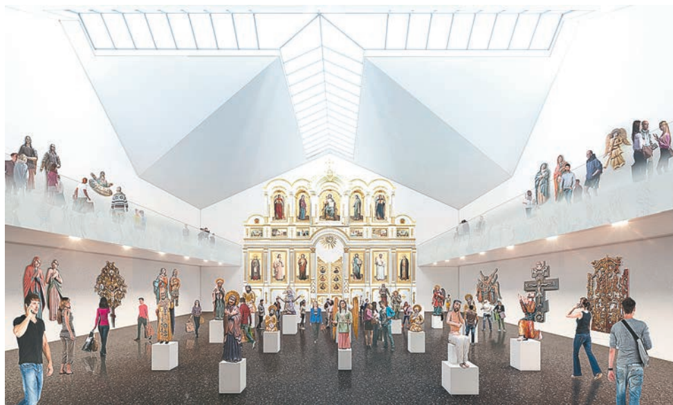
Зал пермской деревянной скульптуры Сергей Чобан спроектировал как подобие церковного пространства

Надо сделать так, чтобы каждый человек увидел в этом проекте своё место и свою выгоду — в самом широком смысле этого слова, тогда проект приобретёт внутреннюю энергию и устойчивость. Представители власти должны увидеть в проекте себя — они ведь тоже люди. Нужно, чтобы те, кто придёт в руководство города и края через несколько лет, даже подумать не могли о том, чтобы предать его забвению. Проект длительный, а беда современной России в том, что со сменой властных элит происходит смена парадигм. Надо найти силы, чтобы обеспечить этому начинанию преемственность.