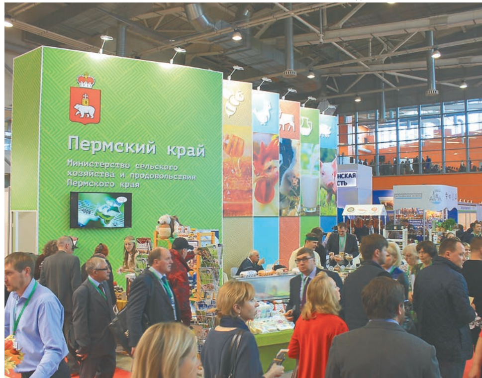
Стенд Пермского края на выставке «Золотая осень — 2018»