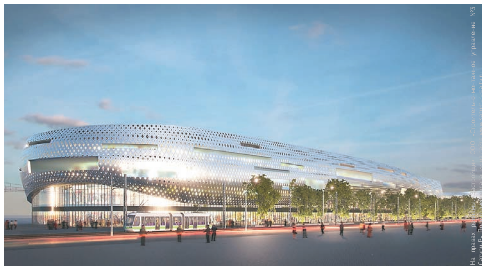
Концепция развлекательного центра в Красных Казармах, вид со стороны площади Карла Маркса и ул. Чернышевского

Сегодня ситуация сильно изменилась. Думаю, цены на квартиры ещё вырастут процентов на 15–20. Год-два будет покупательский разгон — пока примут все госпрограммы поддержки, пока они начнут работать и так далее. К слову, за последние три года строительные материалы подорожали минимум на 15%. Несмотря на это, сами строительные возможности в Перми, думаю, составляют 600–700 тыс. кв. м (сейчас в год строится 400–450 тыс. кв. м — ред.).