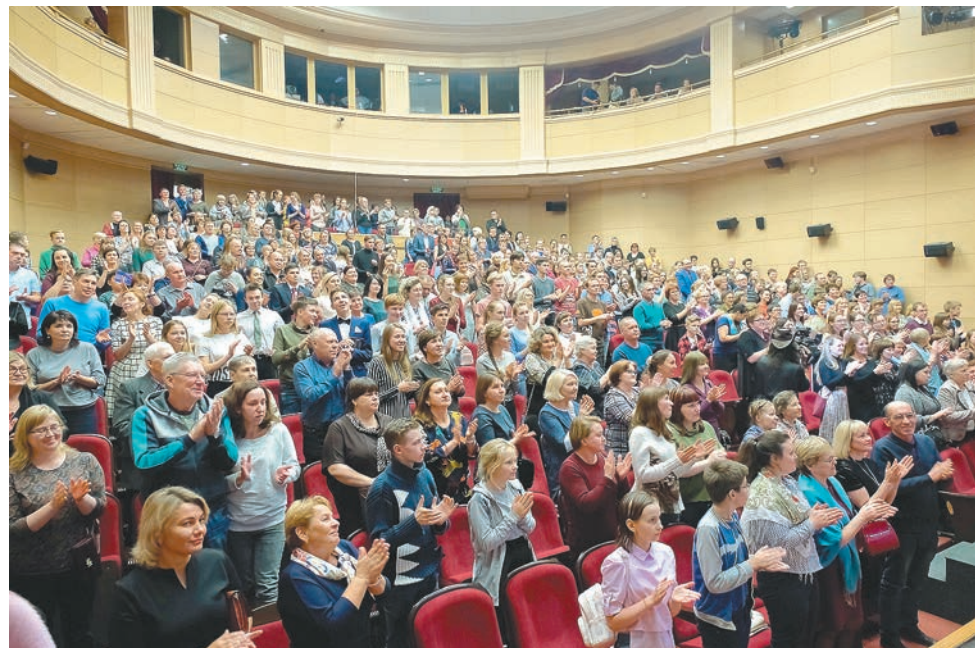
Кудымкарцы стоя аплодировали лысьвенским артистам