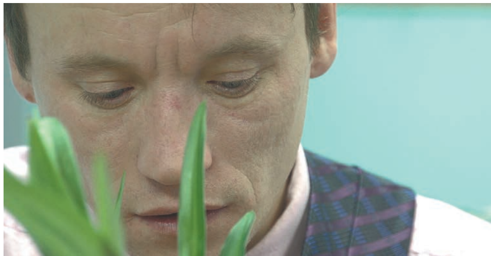
Кадр из фильма «Вырваться. История любви»