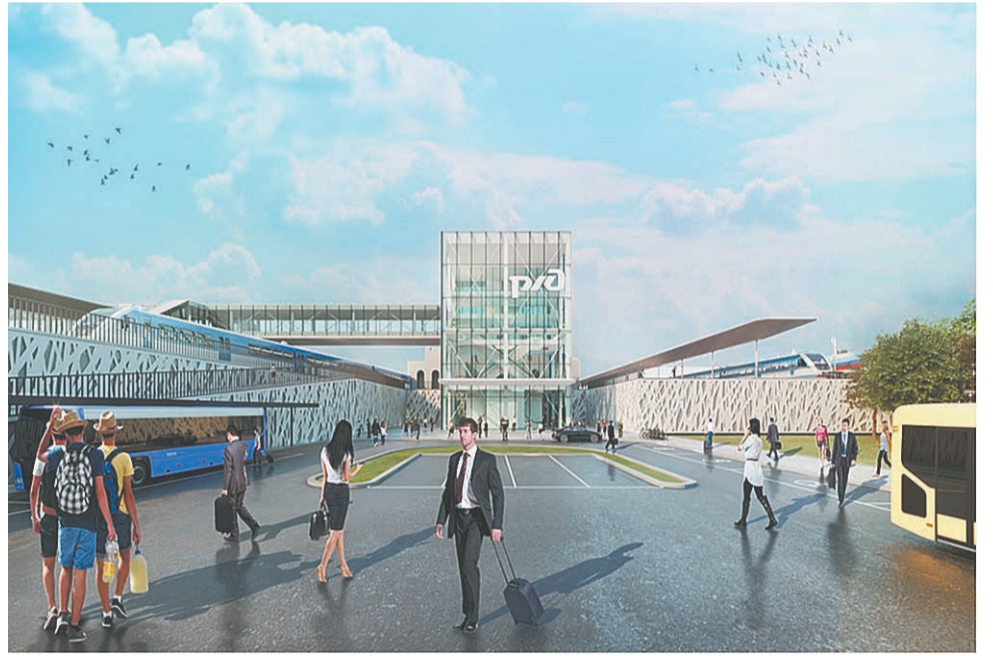
Проект транспортно-пересадочного узла Пермь II

По второму этапу, ул. Вишерская — ул. Папанинцев, сейчас идёт разработка проектно-сметной документации. Планируется, что документация будет готова и пройдёт госэкспертизу до конца 2018 года. По третьему этапу, ул. Папанинцев — площадь Гайдара, готовится техническое задание на разработку проектной документации, а по четвёртому, ул. Локомотивная — ул. Ста-