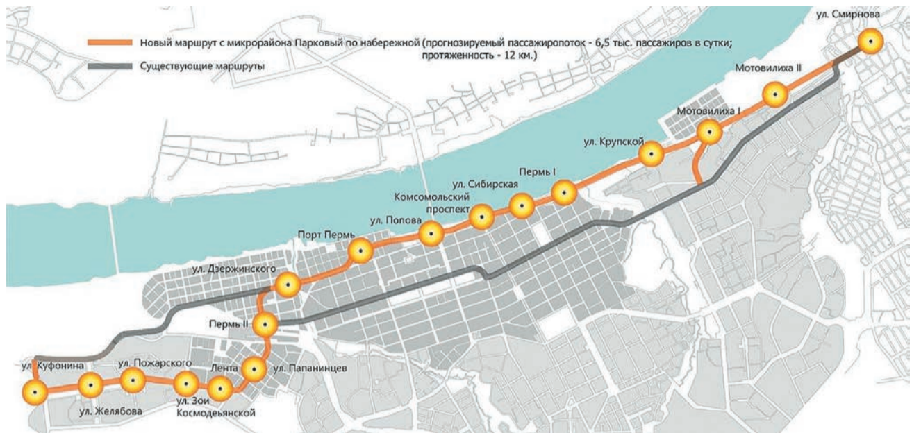
Проект скоростного трамвая Парковый — Мотовилиха

Он также отметил, что по решению властей этот объект будет строить Министерство транспорта Пермского края, а не городская администрация, как планировалось ранее. Министр пояснил, что город уже достаточно давно не строил крупных объектов, у него отсутствует нужный опыт, поэтому есть