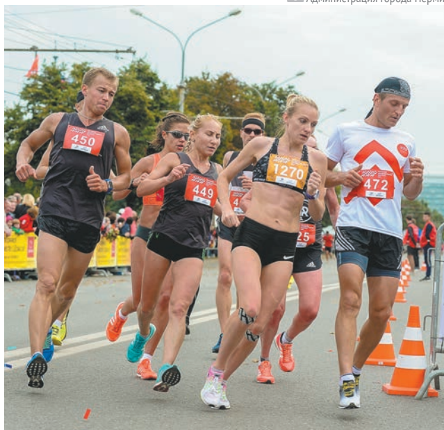
Администрация города Перми

Стоит отметить, что поддерживать темп бегущих на дальние дистанции будут специальные спортсмены — пейсмейкеры. Это бегуны, которые проходят всю дистанцию в определённом