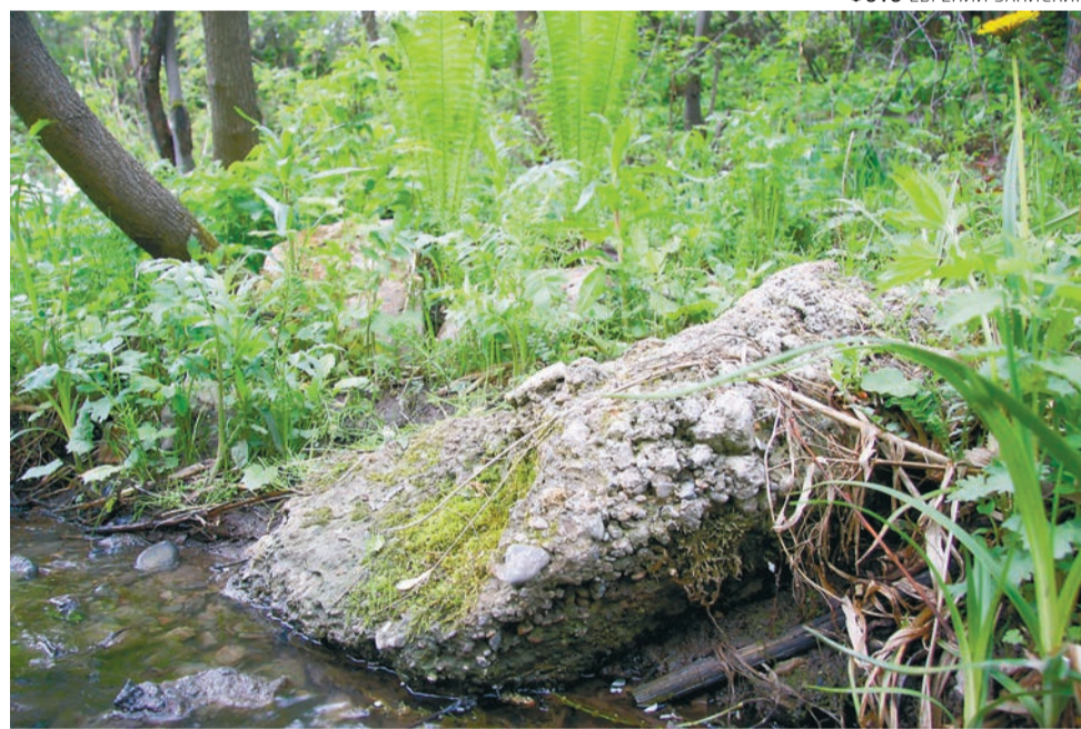
Поспешное либо бездумное освоение долин рек приведёт к разрушению главной ценности — их природной составляющей