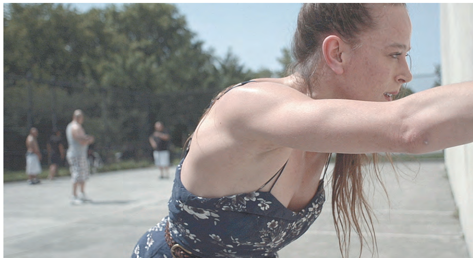
Кадр из фильма «Бобби Джин»

Международный фестиваль документального кино «Флаэртиана» пройдёт в Перми 14–20 сентября 2018 года.