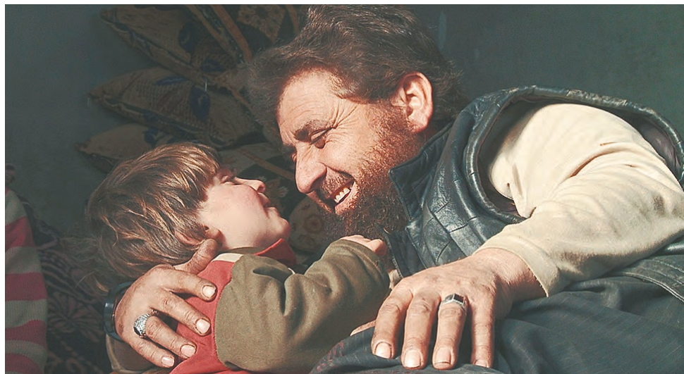
Кадр из фильма «Об отцах и сыновьях»