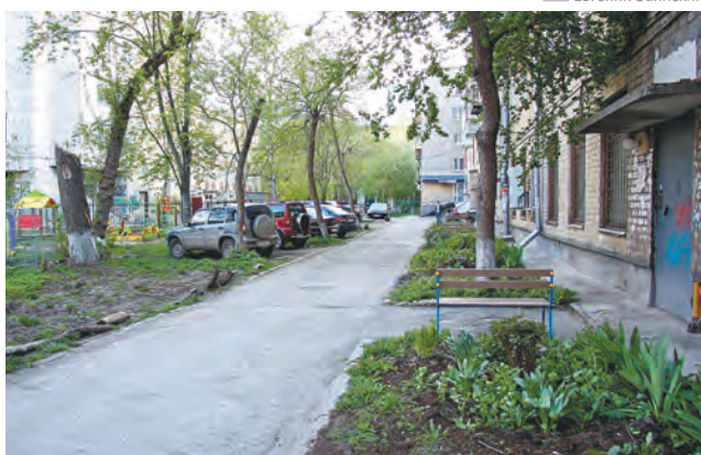
Программа «Комфортная среда», ул. Революции, 38. Двор до ремонта

Озеленение двора — предмет особой гордости жильцов. Вместе с депутатом