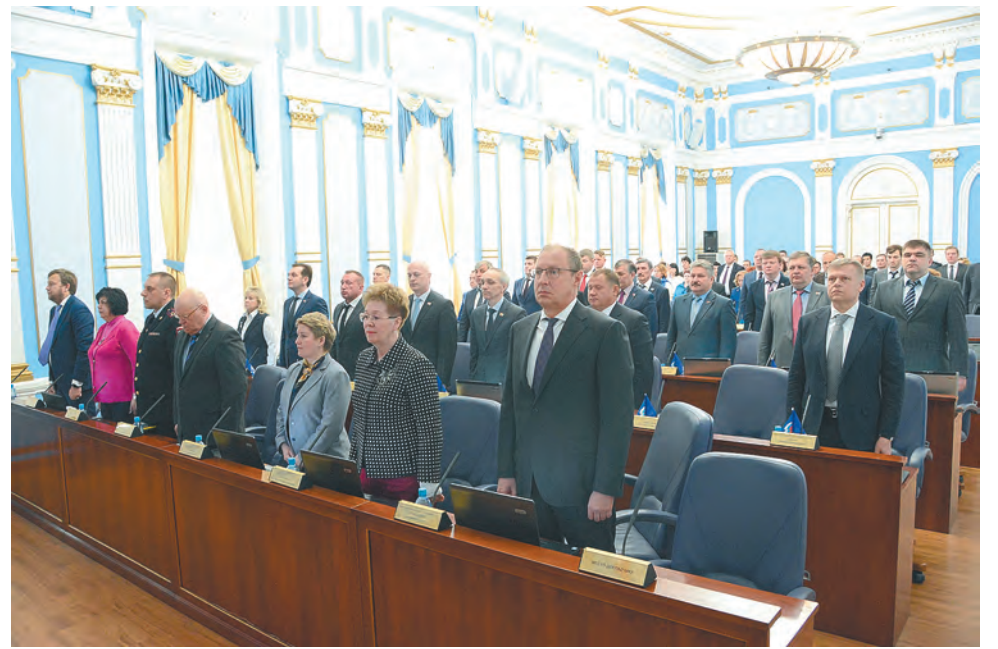
Пермская городская дума

«Надеюсь, что в итоге у нас получится логичный документ, который будет полностью отражать развитие