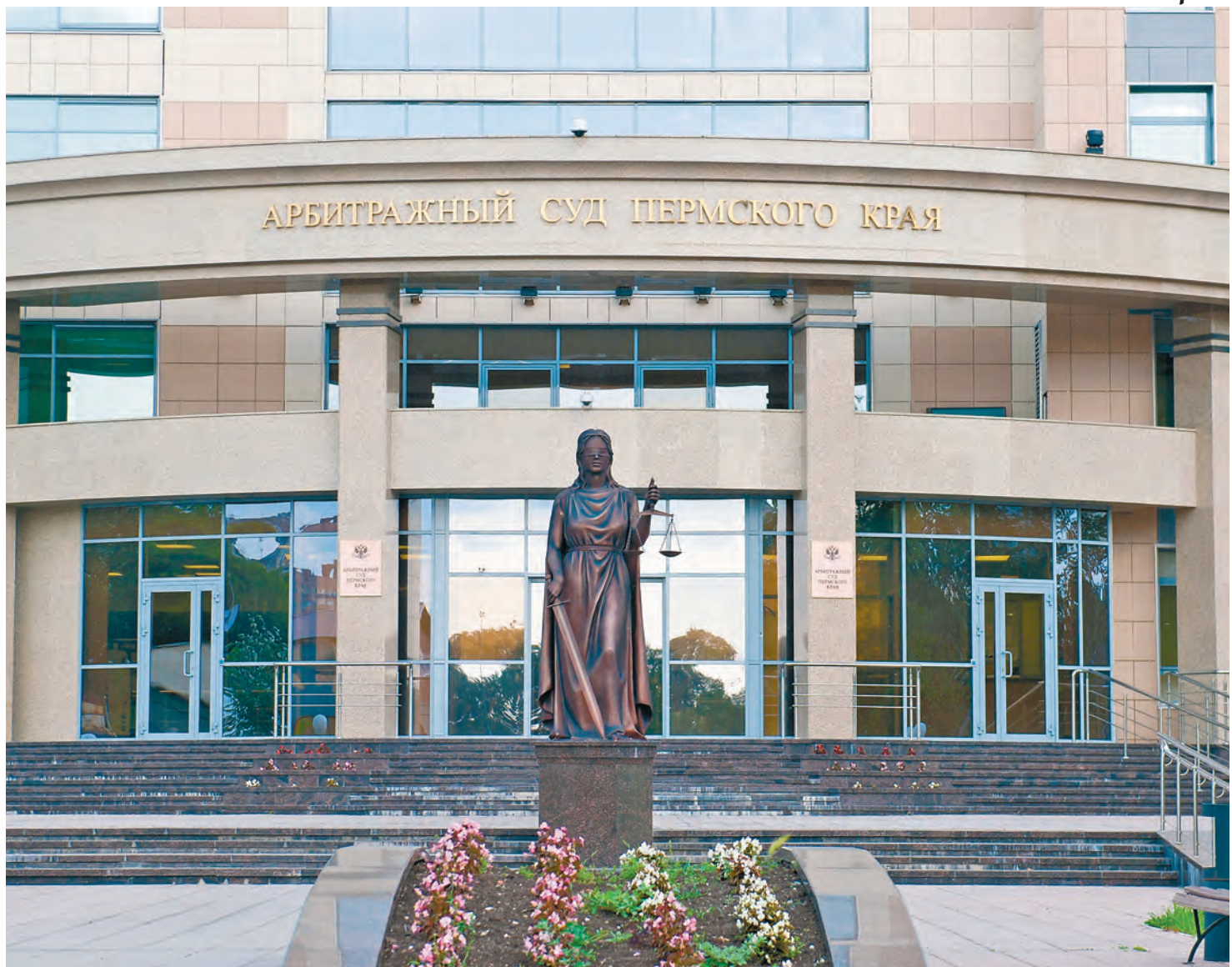
Арбитражный суд в «субсидиарных» делах вынужден будет вести следствие, что ему совершенно несвойственно